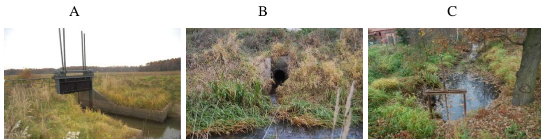
Rysunek 2. Urządzenia hydrotechniczne wspomagające retencjonowanie wody w zbiorniku Brodno (autor: Edyta Nowicka)