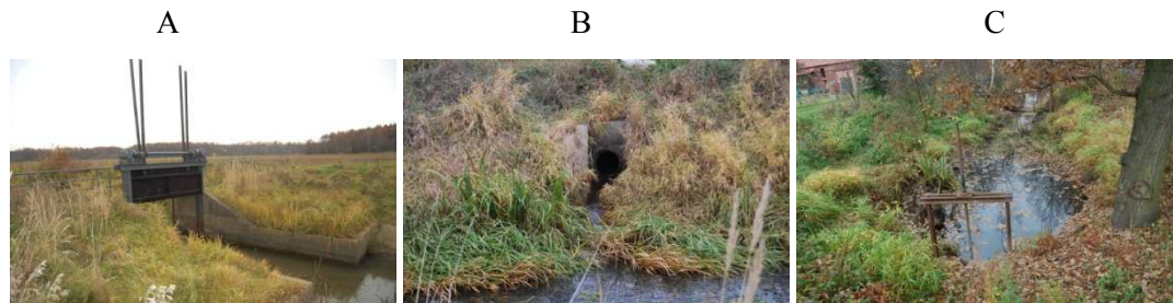
Rysunek 2. Urządzenia hydrotechniczne wspomagające retencjonowanie wody w zbiorniku Brodno (autor: Edyta Nowicka)