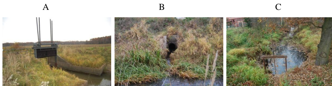
Rysunek 2. Urządzenia hydrotechniczne wspomagające retencjonowanie wody w zbiorniku Brodno (autor: Edyta Nowicka)