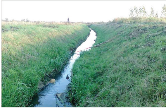
Rysunek 1. Osunięcie skarp rowu R. Odcinek poniżej przekroju 4+680 zaznaczonego na rysunku 2