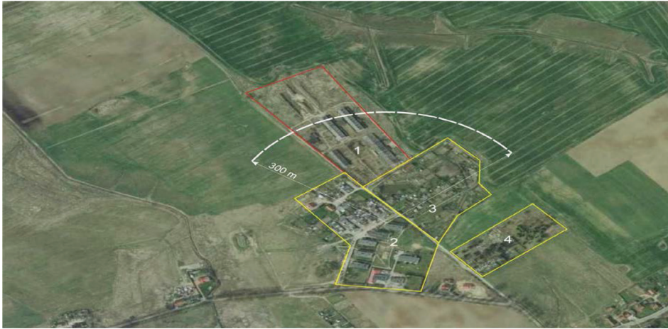
Rysunek 3. Lokalizacja fermy w Sząbruku. Oznaczenia: 1 – teren fermy, 2 – osiedle mieszkaniowe, 3 – ogrody działkowe, 4 – cmentarz parafialny

Figure 3. The location of a breeding farm in Sząbruk. Legend: 1 – the farm's premises, 2 – housing estate, 3 – allotment garden, 4 – parish cemetery