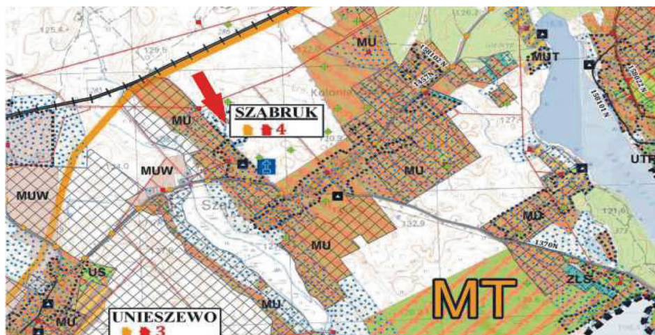
Rysunek 4. Fragment rysunku Studium uwarunkowań i kierunków zagospodarowania przestrzennego gminy Gietrzwałd

mogłyby być związane tylko z rolniczym użytkowaniem terenu. Pozostaje więc dotychczasowy sposób użytkowania – np. ferma hodowlana, co absolutnie nie rozwiązuje konfliktu przestrzennego opisanego powyżej albo rekultywacja terenu i przeznaczenie gruntu pod uprawy rolne.