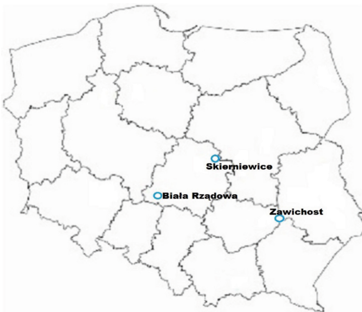
Rysunek.1. Lokalizacja stacji meteo uwzględnionych w badaniach.

Celem opracowania jest ocena potrzeb wodnych jabłoni oraz wysokości opadów efektywnych co pozwoli na określenie potrzeb nawadniania tak ważnego dla gospodarki gatunku roślin sadowniczych. Dane meteorologiczne obejmujące okresy wegetacyjne od maja do września w latach 2011 – 2016. Dane pochodziły z trzech automatycznych stacji meteorologicznych (iMetos – Pessl Austria) rozmieszczonych w różnych regionach Polski: Skierniewice (N-51°57', E-20°09'), Biała Rządowa (N-51°15', E-18°27') i Zawichost (N-50°48', E-21°51').