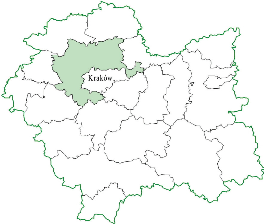
Rysunek 1. Położenie powiatu krakowskiego w woj. małopolskim.

km 2 . Wynika stąd, że w ciągu tego okresu liczba ludności powiatu zwiększyła się o ok. 26,7 tys. osób. Na terenie powiatu zlokalizowane są dwa lotniska, a obszar ten znajduje się w bezpośrednim oddziaływaniu obszaru metropolitalnego Krakowa. Wszystko to świadczy o dużym potencjale rozwojowym badanego terenu.