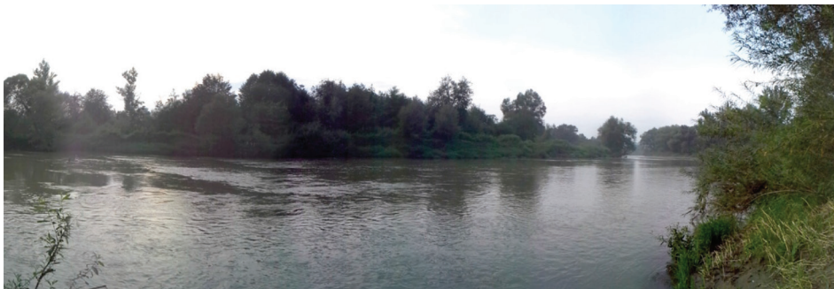
Rysunek 3. Rzeka Ropa (autor: Magdalena Jarosz)