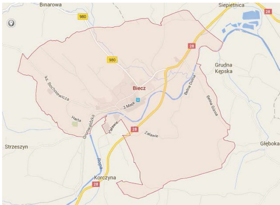
Rysunek 1. Rzeka Ropa na tle miasta Biecz (mapa google)

Badaniami objęto 63 działki ewidencyjne, w zakresie których nastąpiła regulacja granic. Analizowane działki pogrupowano w czterech przedziałach klasowych o obszarach 0-0,20 ha, 0,21-0,50 ha, 0,51-1ha, powyżej 1ha. Najliczniejszą grupę stanowią najmniejsze działki o powierzchni nie przekraczającej 20 arów (26 działek). Dwa kolejne przedziały wielkości zawierają zbliżoną do siebie liczebność 16 i 17 działek. W ostatnim przedziale o powierzchni powyżej 1 ha, odnotowano najmniej, bo jedynie 4 działki. Ustalanie linii brzegu spowodowało, że łączna powierzchnia gruntów dla wydzielonych działek znajdujących się pod wodami, wyniosła około 14,5 ha. Pozostała powierzchnia o dotychczasowym przeznaczeniu zmniejszyła się z 34 ha do około 19,5 ha. Skala zmian dla obszaru zajętego przez wodę w stosunku do pierwotnego sięga aż 42% wyjściowej powierzchni. Sytuacja ta dobrze, obrazuje w jakim zakresie wody płynące mogą zmieniać swój zasięg, powodując utrudnienia w korzystaniu z przyległych gruntów.