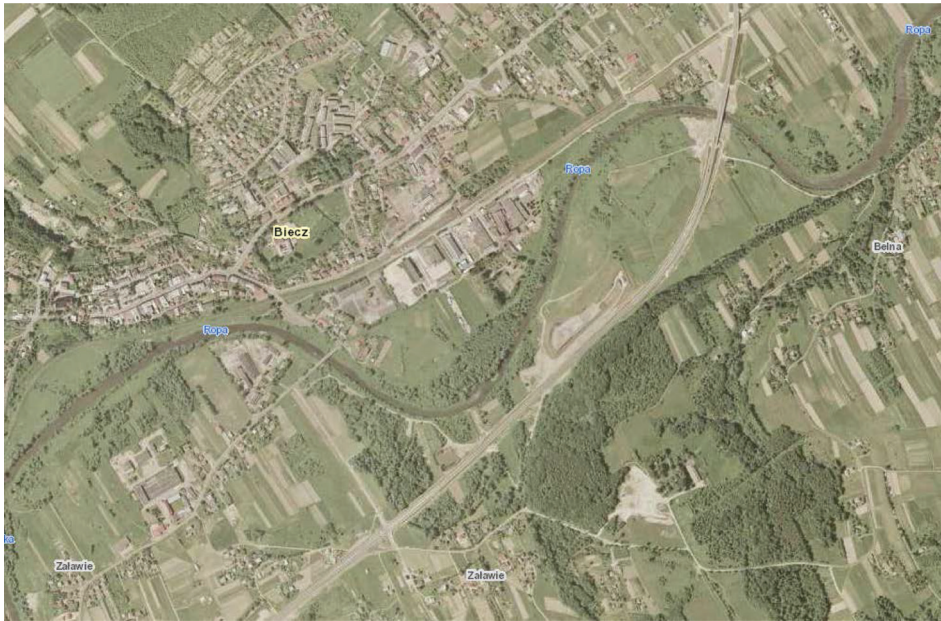
Rysunek 2. Fragment ortofotomapy rzeki Ropa (geoportal2)

zakresie została zajęta przez wody rzeki Ropa, ale porównując je z materiałem kartograficznym można określić faktyczne przemieszczenie zasięgu wód oraz skalę tego zjawiska. Dla ułatwienia opisu zaistniałych zmian, posłużono się graficznym przedstawieniem procentowego udziału zajętych obszarów badanych działek (rys. 4).