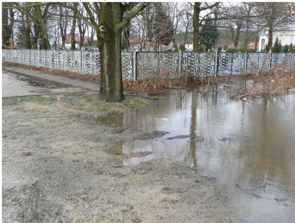
Rysunek 4. Miłoszyce gm. Jelcz-Laskowice. Podtopiony cmentarz. Figure 4. Miłoszyce municipal Jelcz –Laskowice. Flooded cemetery

20 km od centrum miasta. W przypadku tej miejscowości problemem nie są gleby, których klasy bonitacyjne są niskie (V i VI klasa), przez co produkcja rolnicza jest nieopłacalna, można je, więc przeznaczyć do odrolnienia. Problem pojawił się, gdyż w trakcie budowy nie uwzględniono istniejących rowów melioracyjnych i nie zadbano o racjonalne odprowadzenie wód opadowych z powierzchni utwardzonych (Rys. 4).