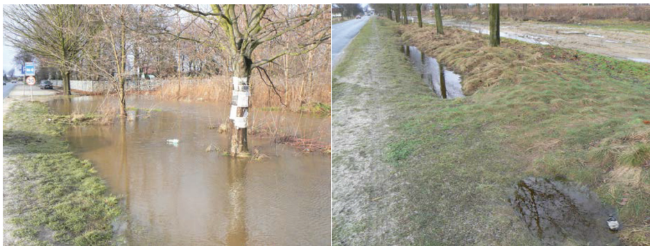
Rysunek 5 i 6. Miłoszyce gm. Jelcz-Laskowice. Podtopienia będące skutkiem niedrożnych rowów melioracyjnych i bądź ich zniszczenia. Figure 5 and 6. Miłoszyce municipal Jelcz-Laskowice. Flooding resulting from clogged ditches and or their destruction.