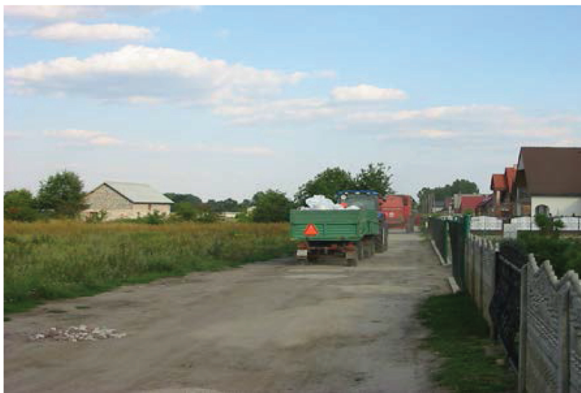
Rysunek 1. Kombajn blokujący drogę dojazdową do działek mieszkaniowych – przekształcenie terenów rolniczych w mieszkaniowe bez uwzględnienia specyfiki istniejących działalności.

Planowanie obszarów wiejskich, a więc takich, które leżą poza granicami administracyjnymi miast jest zadaniem trudnym i odpowiedzialnym. Planista przestrzenny musi posiadać duży zasób wiadomości i wiedzy, w tym również podstawową wiedzę rolniczą. Jest to o tyle ważne, że w odróżnieniu od innych działów gospodarki rolnictwo korzysta i odbywa się w przestrzeni tym samym kształtując i modyfikując ją. Zmiany te w znacznym stopniu dotyczą środowiska przyrodniczego. Jest to jedna z głównych przyczyn sytuacji, w których dochodzić może do wielu konfliktów przestrzennych. Konsekwencją żywiłowego rozwoju miast jest poszukiwanie nowych terenów inwestycyjnych i mieszkaniowych poza jego granicami administracyjnymi. Obszary wiejskie coraz częściej stają się atrakcyjnymi terenami inwestycyjnymi pod działalność niezwiązane z wsią i jej specyfiką. Odbywa się to oczywiście kosztem terenów użytkowanych dotychczas rolniczo.