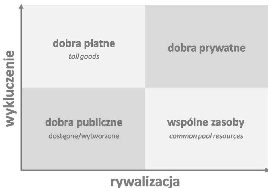
Rysunek 1 Klasyfikacja dóbr wspólnych wg E. Ostrom (źródło: Kupidura, 2013 na podstawie Sgard, 2010)

Dostępność miejsc jest ważnym czynnikiem mającym wpływ na wybory przestrzenne dokonywane przez ludzi. Zawarte w artykule rozważania oparte są przede wszystkim na wynikach współczesnych badań traktujących krajobraz w kategoriach dobra publicznego (Sgard, 2010). Odniesiono się do prac z zakresu ekonomii, bazujących na spuściźnie teoretycznej Gareta Hardina (1968) i Elinor Ostrom (1990), umiejscawiających krajobraz pomiędzy kategorią dóbr wspólnych i kategorią dóbr publicznych. W celu określenia możliwości wizualnego użytkowania krajobrazu wiejskiego, rozumianego w kategorii dobra publicznego, wykorzystano elementy teorii kompozycji przestrzeni obecne w pracy Wejcherta (1984). Przedstawione badania pozwoliły określić zakres działań, które powinny zostać podjęte w celu udostępniania krajobrazu poprzez zabiegi scaleniowo-wymienne.