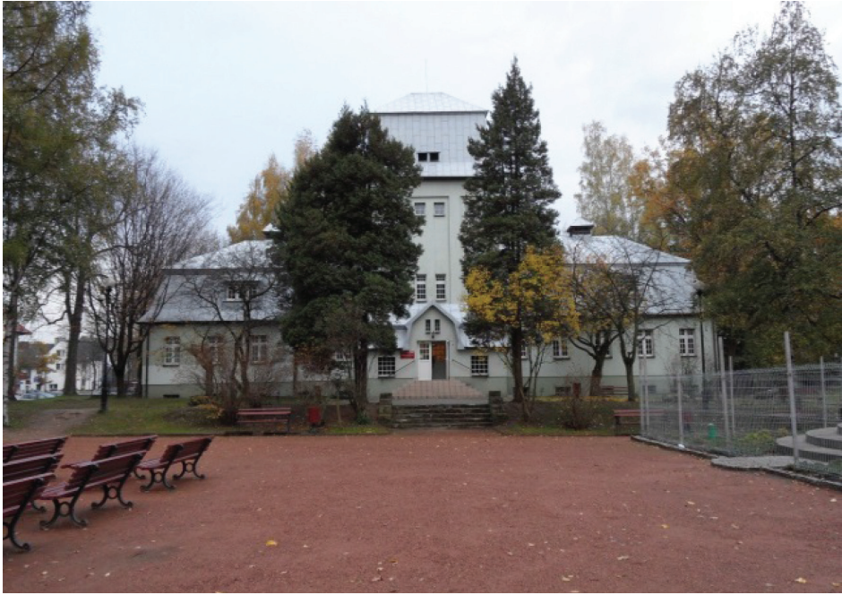
Fotografia 6. Łazienki II (1912 r.) usytuowane naprzeciw Domu Zdrojowego – obecnie Miejski Ośrodek Kultury, Galeria Historii Miasta