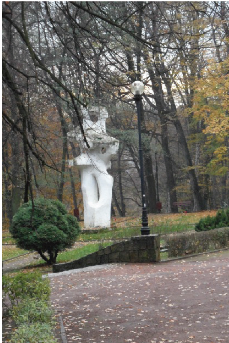
Fotografia 14. Rzeźba w Parku Zdrojowym – Tańcząca para (listopad 2012)

lenia mogły korzystać z ich zdrowotnych walorów, tak, by ocalić uzdrowskie dziedzictwo kulturowe.