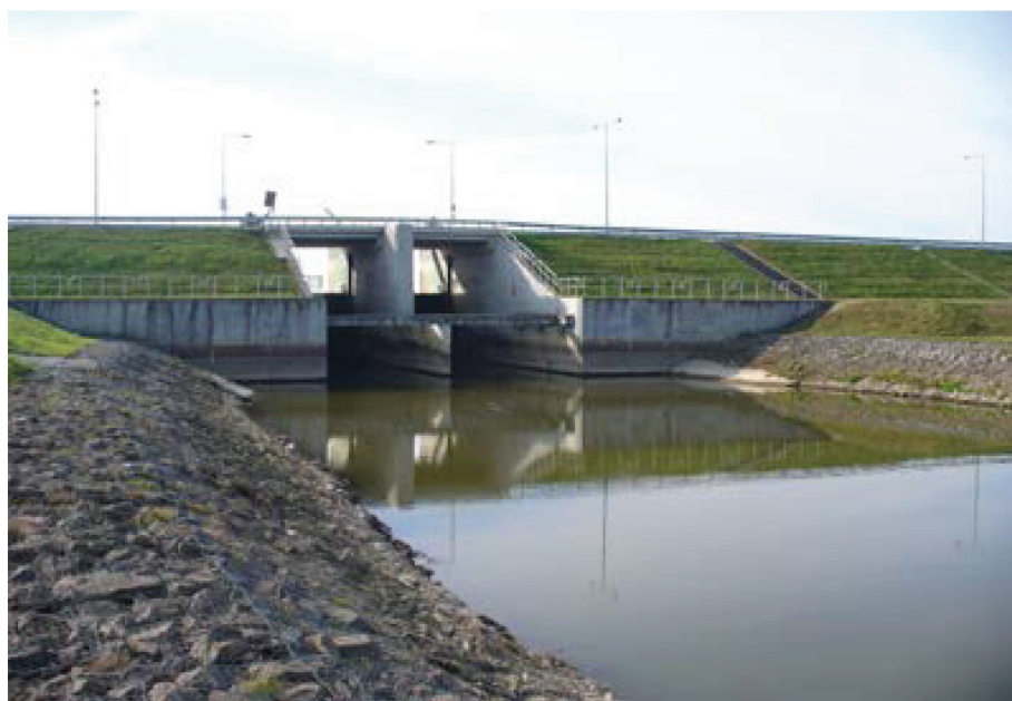
Fotografia 10. Jaz zapory głównej zbiornika Nielisz, przekazanego do użytkowania w 2008 r.