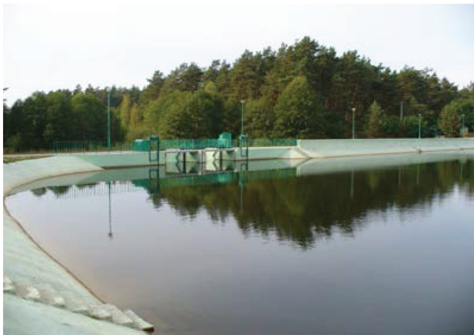
Fotografia 7. Zbiornik Majdan Sopocki o objętości 338 tys. m 3 .