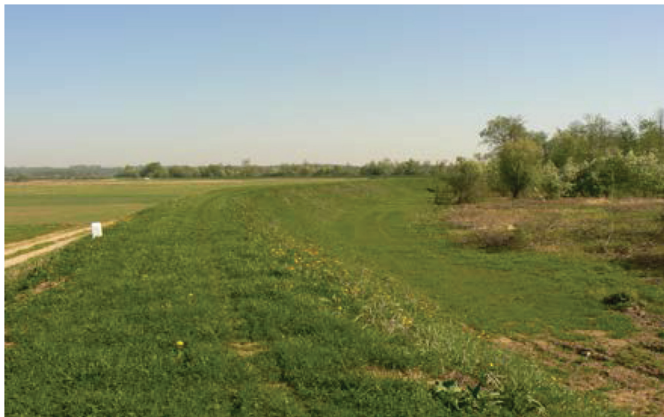
Fotografia 3. Wał przeciwpowodziowy rzeki Wisły na długości 7,1 km w dolinie Janiszowskiej.