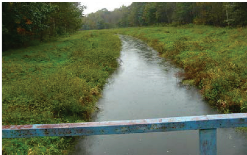
Fotografia 1. Odcinek nawadniający Kanału Wieprz – Krzna w km 65+680 w rejonie rzeki Piwonia