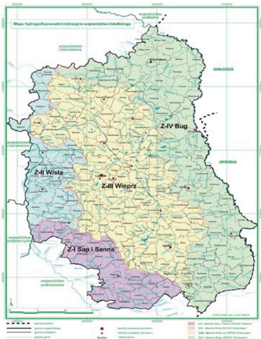
Rysunek 1. Mapa hydrograficzno – administracyjna województwa lubelskiego

Z-III Wieprz i Z-IV Bug). Usytuowanie wydzielonych zlewni na tle podziału administracyjnego Lubelszczyzny ilustruje mapa hydrograficzno – administracyjna województwa lubelskiego (rys. 1).