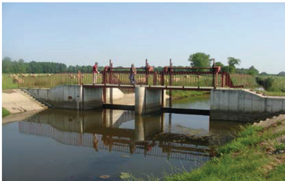
Fotografia 5. Jaz Ortel Królewski o świetle 2 x 4,0 m i wysokości piętrzenia 2,0 m na rzece Zielawie w systemie Kanału Wieprz – Krzna.