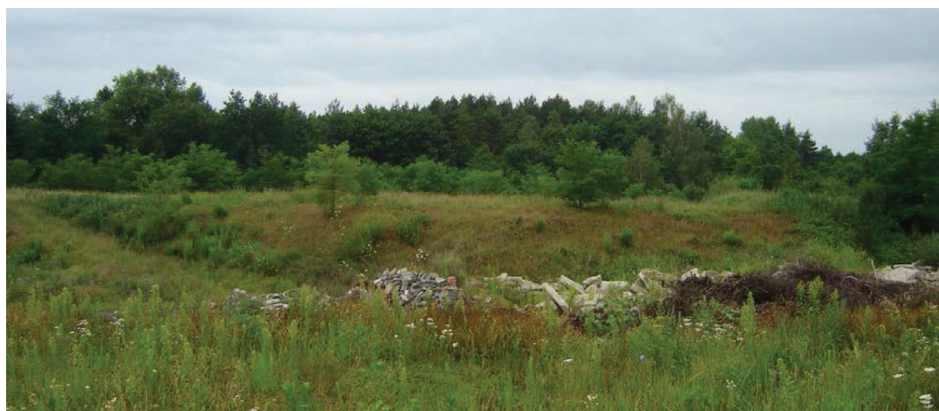
Rysunek 3. Widok na najstarsze kwatery (4 i 5) składowiska w Chełmku, eksploatowane bez uszczelnienia dennego Figure 3. View of the older quarters (number 4 and 5) of the landfill in Chełmek, exploited without the bottom liner