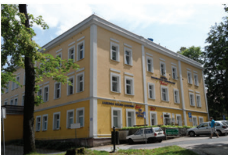
Fot.10. Niepubliczny Zakład Opieki Zdrowotnej „Centrum Rehabilitacji i Reumatologii – Goplana” (fot. E. Gonda-Soroczyńska, lipiec 2013)

Foto. 9. The „Waclaw” Spa Hospital (photograph by E. Gonda-Soroczyńska, July 2013)