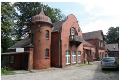
Fot. 15. Zakład kuracji borowinowej – dawniej Łazienki Marii z 1904 roku (fot. E. Gonda-Soroczyńska, lipiec 2013)