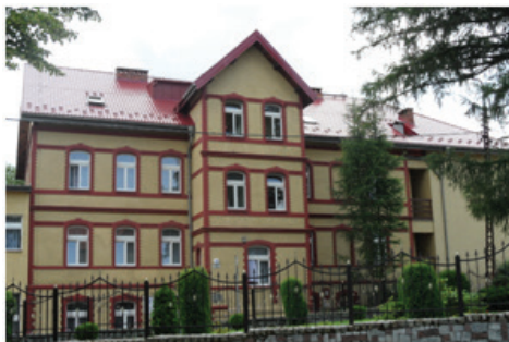
Fot.9. Szpital Uzdrawiskowy „Waclaw” (fot. E. Gonda-Soroczyńska, lipiec 2013)

Foto. 9. The „Waclaw” Spa Hospital (photograph by E. Gonda-Soroczyńska, July 2013)