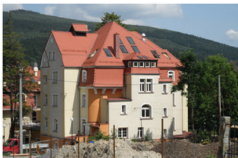
Fot.11. Sanatorium „Słoneczko” po modernizacji (fot. E. Gonda-Soroczyńska, lipiec 2013)

Foto. 10. The „Goplana” Rehabilitation and Rheumatology Centre, a non-public health care facility (photograph by E. Gonda-Soroczyńska, July 2013)