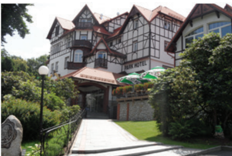
Fot.12. Wielofunkcyjny Park-Hotel znakomicie wkomponowany w stok wzgórza (fot. E. Gonda-Soroczyńska, lipiec 2013)

Foto 11. The modernised „Słoneczko” sanatorium (photograph by E. Gonda-Soroczyńska, July 2013)