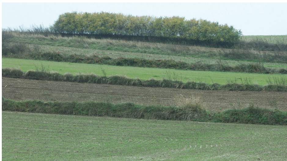
Rysunek 1. Terasy na zboczu lessowym oddzielone wąskimi skarpami Figure 1. The terraces on the loess slopes separated by narrow escarpments

stanowi wówczas tylko 22,5% średniego rocznego odpływu. Wielkości szkód erozyjnych też nie miały wyraźnego związku z wielkością opadów rocznych, a zależały głównie od natężenia i czasu trwania opadów, agrotechniki oraz gatunku i fazy rozwoju roślinności. Najwięcej szkód erozyjnych rejestrowano na polach o wzdłuż stokowy kierunku uprawy bez okrywy roślinnej. Liczne szkody erozyjne odnotowano także na polach z uprawą roślin okopowych oraz obsianych zbożami jarymi we wczesnych fazach rozwoju (okresy wschodów lub krzewienia się). Intensywnie erodowane są również technologiczne drogi rolnicze, które są trasami skoncentrowanego spływu wód powierzchniowych i wyerodowanego materiału glebowego. Średni roczny wskaźnik denudacji mechanicznej dla zlewni wyniósł 94 \text{ t} \times \text{km}^{-2} co jest jednoznaczne z obniżaniem się jej powierzchni o 0,067 mm w ciągu rok. z ogólnej masy wyerodowanego materiału glebowego średniorocznie około 54% wynoszone jest poza zlewnię.