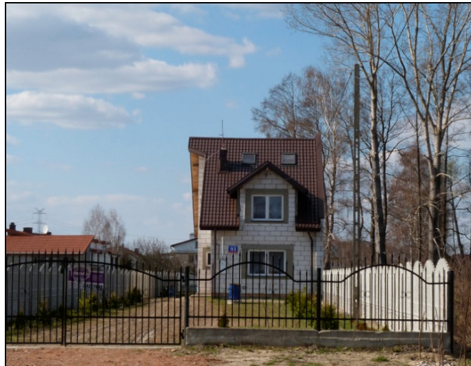
Rysunek 2. „Luka” w zabudowie Figure 2. Housing „gap”