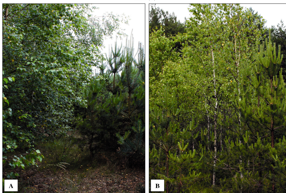
Fotografia 2. Granica między młodnikami sosnowymi a brzozowymi na terenach porolnym (A) i leśnym (B) Foto 2. Border of forest plantation of Scots pine (P-So) and birch (P-Brz) on post-arable land (A) and forest land (B)