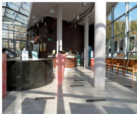
Fotografia 6. Wnętrze Pijalni wód (fot. autorki, październik 2012)