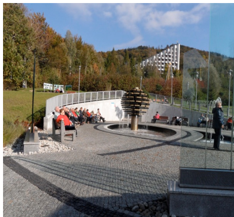
Fotografia 7. Fontanna w bezpośrednim sąsiedztwie Pijalni wód leczniczych (fot. autorki, październik 2012)