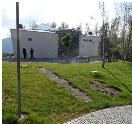
Fotografia 8. Budynek pijalni wód leczniczych oddany do użytku w czerwcu 2012 roku