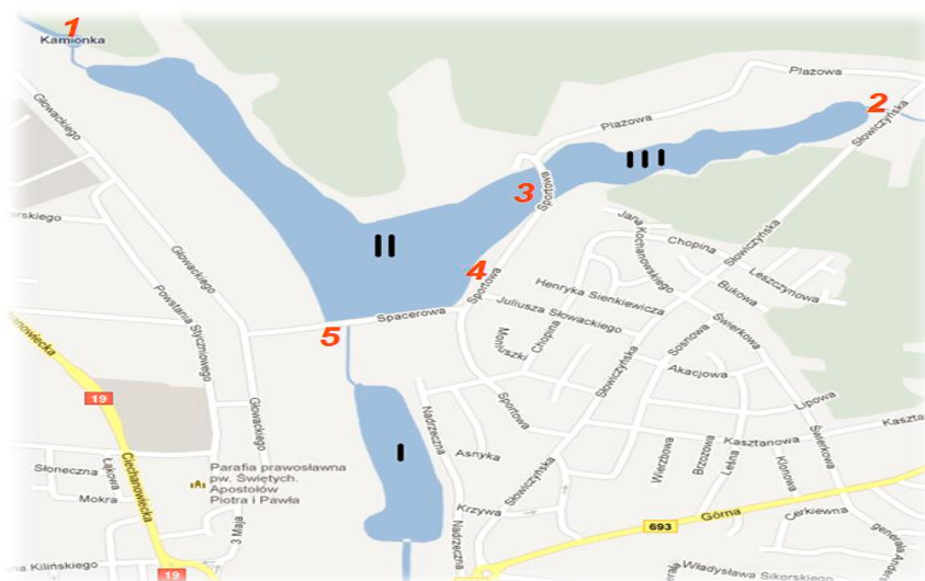
Rysunek 1. Lokalizacja punktów poboru prób Figure 1. Location of measurement points

Analizy mające pomóc w ocenie stanu jakościowego zbiornika nr II w Siemiatyczach wykonano w roku 2011 dwukrotnie: przed rozpoczęciem sezonu kąpieliskowego 24. maja i w pełni sezonu 8. sierpnia. Poboru prób wody dokonano w 5 punktach pomiarowych: na rzece Kamiance powyżej Zbiornika nr II (nr 1), rzece Mahomet powyżej ujścia do Zbiornika nr III (nr 2), przepuszczeniu ze zbiornika nr III do zbiornika nr II (nr 3), kąpielisku zorganizowanym (nr 4) i odpływie ze zbiornika nr II do zbiornika nr I (nr 5). Dokładną lokalizację punktów zobrazowano na rys. 1.