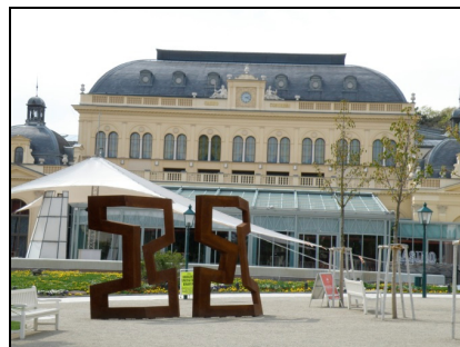
Fotografia 14. Baden bei Wien, elementy małej architektury Parku Zdrojowego (kwiecień 2010)

Photo 13. Baden bei Wien, view from the Spa Park onto the spa houses (April 2010)