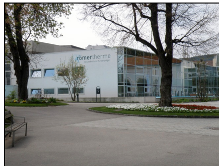
Fotografia 4. Baden bei Wien, Römertherme Baden [Termy Rzymskie] (kwiecień 2010)

Photo 3. Baden bei Wien, Leopoldsbad [Leopold's Bath] (April 2010)