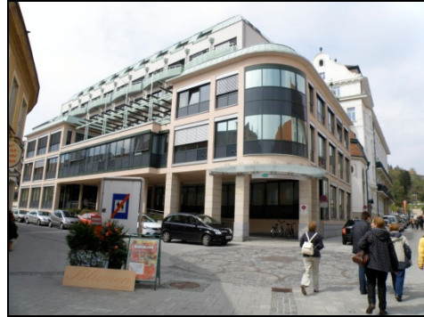
Fotografia 2. Baden bei Wien, nowa zabudowa wydzielonej strefy ruchu pieszego, nieopodal Parku Zdrojowego (fot. autorki, kwiecień 2010)

Photo 1. Baden bei Wien, the Holy Trinity pillar in the Baden bei Wien centre (Photo by Authoress, April 2010)