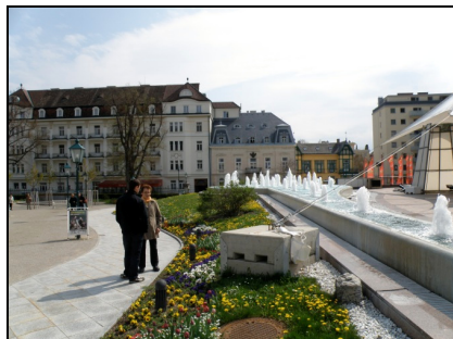
Fotografia 13. Baden bei Wien, widok od strony Parku Zdrojowego na domy uzdrowiskowe (fot. autorki, kwiecień 2010)

Photo 13. Baden bei Wien, view from the Spa Park onto the spa houses (Photo by Authoress, April 2010)