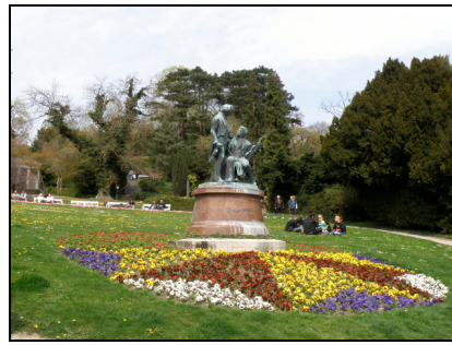
Fotografia 12. Baden bei Wien, pomnik Lannera i Straussa (fot. autorki, kwiecień 2010) Photo 12. Baden bei Wien, statue of Lanner and Strauss (Photo by Authoress, April 2010)