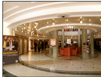
Fotografia 8. Baden bei Wien, Congress Casino Baden [Kongresowe Kasyno Baden] , wewnątrz – strefa wejściowa (fot. autorki, kwiecień 2010) Photo 8. Baden bei Wien, the Congress Casino Baden, interior – entrance zone (Photo by Authoress, April 2010)

W samym centrum miasta, przy placu Brusatti z postojem taksówek i autokarów, bezpłatnymi publicznymi toaletami, informacją turystyczną, parkingiem wielopoziomowym znajdują się słynne termy rzymskie „Römertherme Baden”. W ciągu 2 lat budowy dwa dotychczasowe tradycyjne kąpieliska w centrum miasta zastąpiono nowoczesnym, przeszklonym obiektem wielofunk-