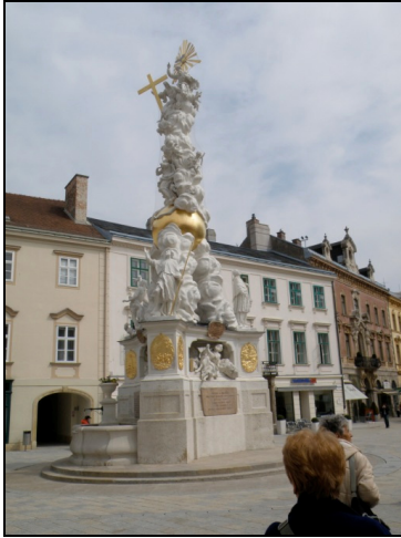
Fotografia 1. Baden bei Wien, kolumna Świętej Trójcy w centrum Baden bei Wien

Photo 1. Baden bei Wien, the Holy Trinity pillar in the Baden bei Wien centre