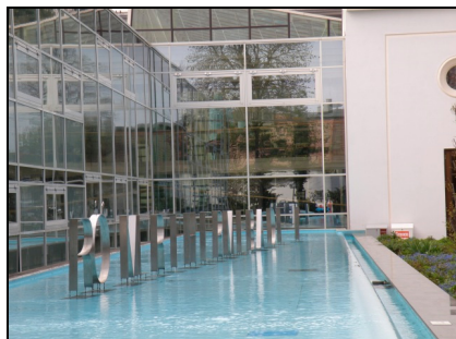
Fotografia 9. Baden bei Wien, Römertherme Baden [termy rzymskie] (fot. autorki, kwiecień 2010)

cyjnym (pow. wody 900 m 2 ) z saunami, basenem sportowym, szkołą pływania, centrum spa.