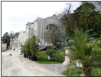
Fotografia 11. Baden bei Wien, Sommerarena (scena letnia) w Parku Zdrojowym (fot. autorki, kwiecień 2010) Photo 11. Baden bei Wien, Sommerarena (Summer Arena) in the Spa Park (Photo by Authoress, April 2010)

które zaspokoić mógł profesjonalny teatr w nowocześnie wybudowanym i urządzonym budynku. W ten sposób wybudowano teatr w Baden. Legitymuje się on prawie 300 letnią tradycją teatralną. Mieści 700 widzów. Od października do marca wystawiane są w nim sztuki teatralne, musicale, operetki. Przez pozostałe miesiące sezonu letniego funkcję tego teatru przejmuje Sommerarena (tłum. scena letnia) w Parku Zdrojowym.