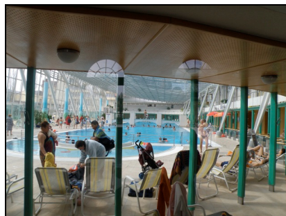
Fotografia 10. Baden bei Wien, Römertherme Baden [termy rzymskie] wewnątrz

Photo 9. Baden bei Wien, Römertherme Baden [Roman thermae]