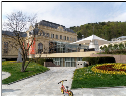
Fotografia 7. Baden bei Wien, Congress Casino Baden [Kongresowe Kasyno Baden] (fot. autorki, kwiecień 2010) Photo 7. Baden bei Wien, the Congress Casino Baden (Photo by Authoress, April 2010)

Na uwagę zasługuje zabudowa miejscowości, jej układ przestrzenny, rodzaje zabudowy, wiek obiektów kubaturowych, poprawnie i niedawno odrestaurowanych. Liczne są budynki w stylu Biedermeier. Wśród uzdrowskiej zabudowy Parku Zdrojowego na plan pierwszy wyłania się budynek Congress Casino Baden. Stanowi on dominantę urbanistyczną, zwłaszcza w tej uzdrowskiej części miasta. Wcześniej budynek ten pełnił funkcję sanatorium, obecnie jest to kasyno gry i centrum konferencyjne. Tu powstały najstarsze łaźienki z wodą termalną „Römerquelle”, tu założono dla cesarzowej Marii Teresy pierwszy park w mieście, na terenie obecnego Parku Zdrojowego – jednego z najpiękniejszych ogrodów historycznych Austrii. Dzięki muzyce podczas letnich koncertów, dzięki atrakcjom oferowanym przez kasyno gry, w tym miejscu, tej szczególnej miejscowości uzdrowskiej odnaleźć można o każdej porze roku wyjątkową atmosferę uzdrowiska Baden, pamiętającą czasy epok minionych.