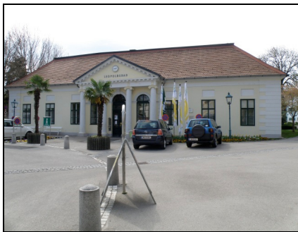
Fotografia 3. Baden bei Wien, Leopoldsbad [Łaźnia Leopolda] (fot. autorki, kwiecień 2010)

Photo 2. Baden bei Wien, new pedestrian zone architecture near the Spa Park (Photo by Authoress, April 2010)