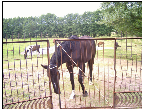
Rysunek 10. Wybieg dla koni (mało zacieniony) Figure 10. Paddock (less shaded)