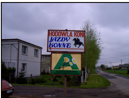
Rysunek 17. Reklama przy drodze Figure 17. Advertising on the road

Pozytywną rzeczą, którą ujawniły badania jest to, że 23,8% gospodarzy planuje nowe działania inwestycyjne, by podnieść standard usługi. Jeden z właścicieli pragnie wzbogacić swój produkt poprzez wybudowanie hali sportowej. Dwóm innym przyświeca cel postawienia hali do zawodów jeździeckich oraz krytej ujeżdżalni. Byli też tacy, którzy deklarowali zakup koni do przewozu bryczką i kuców dla dzieci.