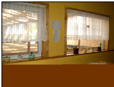
Rysunek 14. Jadalnia połączona z ujeżdżalnią

Figure 13. Peace in the immediate vicinity of, the stables for the horses