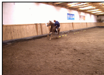
Rysunek 4. Pokaz ćwiczeń akrobatycznych na koniu Figure 4. Demonstration of acrobatic exercises on horseback