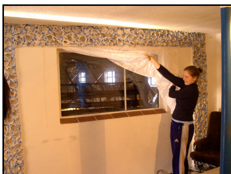
Rysunek 13. Pokój w bezpośrednim sąsiedztwie stajni dla koni

Respondenci zdając sobie sprawę z tego, że aby utrzymać się na konkurencyjnym rynku muszą ciągle uatrakcyjnić i podnosić jakość usługi. Wprowadzają różne innowacyjne w tym względzie pomysły. Przykładem może być umiejscowienie pokoju gościnnego w bezpośrednim sąsiedztwie stajni, która oddzielona jest od niego przeszklonym oknem (rys. 13). Dzięki temu miłośnicy koni mogą obcować ze zwierzętami, zwłaszcza w porze nocnej. Niewątpliwie dużą atrakcją w jednym z gospodarstw jest możliwość obserwowania jazdy konnej z jadalni, połączonej szybą z krytą ujeżdżalnią (rys. 14). Podobny przykład zaobserwowano też w innej zagrodzie (rys. 15). Tu dodatkowo miejsce spożywania posiłków miało wystrój typowo nawiązujący do jeździectwa. Usługodawcy starają się też wyeksponować swoją ofertę, poprzez stawianie na swojej posesji lub przy drodze znaków informacyjnych, reklamujących omawianą usługę (rys. 16 i 17). Ponadto dbają, aby w bezpośrednim otoczeniu placów treningowych przygotowane były miejsca do odpoczynku (rys. 18).