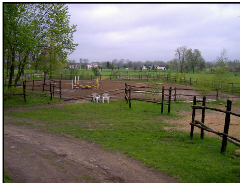
Rysunek 9. Plac treningowy Figure 9. Training area