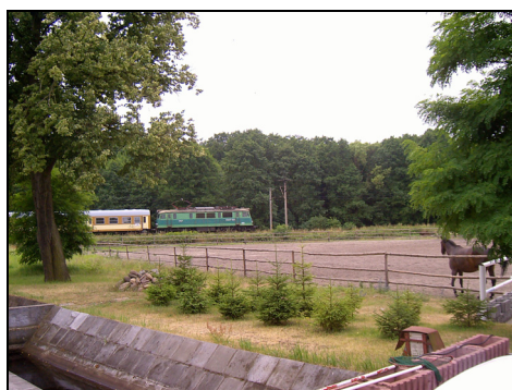
Rysunek 11. Padok w pobliżu trakcji kolejowej Figure 11. Paddock near the railway traction