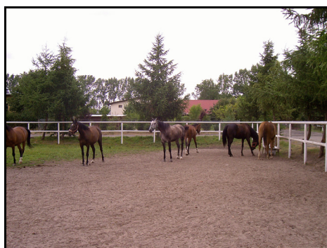
Rysunek 1. Plac treningowy Figure 1. Training area

Gospodarze organizują w swoich stadninach różne formy wypoczynku „w siodle”. Są one uzależnione od stopnia zaawansowania uczestnika. Dla początkujących przygotowuje się naukę pełnej obsługi konia (czyszczenie, siodłanie, kielznanie konia oraz porządkowanie stajni i konserwację sprzętu jeździeckiego), jak również naukę jazdy na lonży. Jazda odbywa się na palcu treningowym (Rys. 1) lub hali (Rys. 2). Nowicjusze uczą się m.in. utrzymania równowagi w siodle, trzymania wodzy i dosiadać oraz pierwszej jazdy kłusem. Gospodarze prowadzą dla nich zajęcia z zasad bezpieczeństwa w zakresie jazdy i obsługi koni. Dla bardziej zaawansowanych uczestników proponuje się jazdę na maneżu (ujeżdżalni) bądź w terenie.