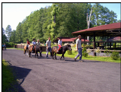
Rysunek 3. Jazda na kucach akrobatycznych na koniu Figure 3. Riding a pony

Propozycje spędzania czasu wolnego uwarunkowane są infrastrukturą niezbędną dla osób jeżdżących konno. Tylko w dwóch gospodarstwach odnotowano kryte ujeżdżalnie. Posiadały one też najbardziej bogatą dla turystów ofertę. Obok indywidualnych nauk jazdy, specjalizowały się w organizacji obozów jeździeckich, turnusów rehabilitacyjnych, rajdów konnych, kuligów, kursów instruktorskich i przeprowadzały egzaminy na odznaki jeździeckie. Zwraçały szczególną uwagę na dostosowanie zwierząt proporcjonalnie do wieku, wagi i wzrostu jeźdźcy. W gospodarstwach posiadających w ofercie do 13 koni organizuje się głównie naukę jazdy, obozy i kuligi. Obozy są 7 i 14 dniowe zarówno dla dzieci (od 8 lat), jak i dorosłych. Gospodarze prowadzą też półkolonie letnie dla dzieci i młodzieży. Proponują zajęcia hippiczne (oprowadzenie na koniach lub kucach, woltyżerka-pokaz ćwiczeń akrobatycznych lub gimnastycznych na koniu- rys. 3 i 4) oraz rajdy konne (2-4 dniowe), połączone z pieczeniem dzika lub barana. W 12 gospodarstwach istnieje możliwość przyjazdu z własnym koniem i skorzystania z przygotowanych w stajni boksów (rys. 5 i 6). Prowadzą one też wypożyczalnie sprzętu jeździeckiego, jak również jego sprzedaż (rys. 7 i 8).