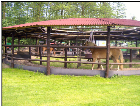
Rysunek 12. Chodzenie koni „w karuzeli” Figure 12. Walking horses "in carousel"

Duży odsetek gospodarstw (52,4%) już w chwili uruchamiania działalności agroturystycznej czynił prace przygotowawcze z myślą o rekreacji konnej. Z przeprowadzonych badań wynika, że ta grupa właścicieli wśród najczęściej wymienianych prac przystosowawczych wskazywała głównie zakup dodatkowych koni. Na starcie posiadała też odpowiednie zaplecze do uprawiania turystyki konnej (stajnie, padoki, konie, kuce). Ci gospodarze to najczęściej miłośnicy koni, którzy spełniają poprzez tę usługę swoje pasje i zainteresowania. W pozostałej grupie usługodawców (47,6%) zaobserwowano zupełnie odmienną sytuację. Oni dopiero w przeciągu 3-5 lat po uruchomieniu agroturystyki, poszerzyli usługę o jazdę konną. Takie inicjatywy były podyktowane identyfikacją