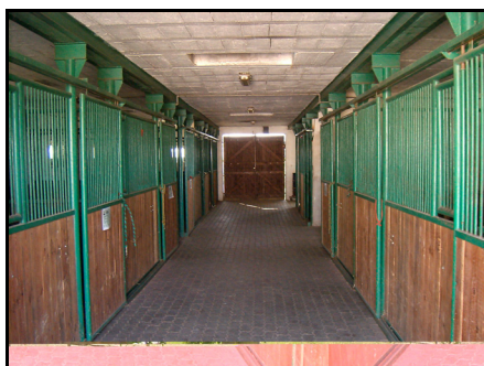
Rysunek 5. Stajnia dla koni Figure 5. Stable for horses