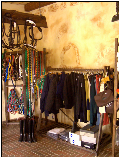
Rysunek 7. Sprzęt jeździecki na sprzedaż Figure 7. Riding equipment for sale