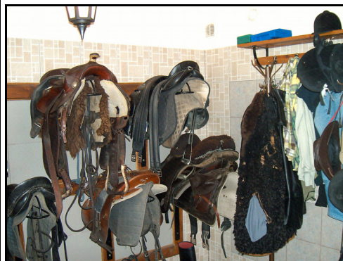
Rysunek 8. Sprzęt jeździecki do wypożyczenia Figure 8. Riding equipment for rental

Posiadacze najmniejszej liczby koni nastawieni są głównie na prowadzenie indywidualnych lekcji jazdy konnej, krótkie wyjazdy z jeźdźcami w teren oraz organizowanie przejażdżek bryczką. Dla wyróżnionych 21 gospodarstw jazda konna jest główną atrakcją zagrody i jednocześnie cechą wyróżniającą je na konkurencyjnym rynku. Usługodawcy postrzegają ją za gwarant istotny przy sprzedaży usługi. Sześciu organizatorów wypoczynku „w siodle” prowadzi działalność hotelową dla koni, zapewniając im wybieg i opiekę weterynaryjną. Zdaniem respondentów to następna cecha dobrego wizerunku ich ofert.