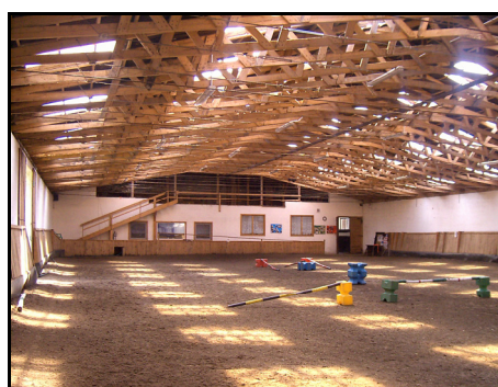
Rysunek 2. Hala treningowa Figure 2. Training hall