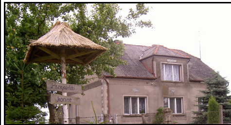
Rysunek 16. Znak informacyjny na posesji gospodarza Figure 16. Informational sign on the property of the host

Pozytywną rzeczą, którą ujawniły badania jest to, że 23,8% gospodarzy planuje nowe działania inwestycyjne, by podnieść standard usługi. Jeden z właścicieli pragnie wzbogacić swój produkt poprzez wybudowanie hali sportowej. Dwóm innym przyświeca cel postawienia hali do zawodów jeździeckich oraz krytej ujeżdżalni. Byli też tacy, którzy deklarowali zakup koni do przewozu bryczką i kuców dla dzieci.