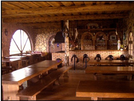
Rysunek 15. Jadalnia połączona z ujeżdżalnią Figure 15. Dining room combined with the riding school

ciami stajennymi oraz teorią jazdy wynosi średnio 700 zł. Gospodarze wprowadzają w tym względzie różne systemy ulg, w zależności od liczby gości, ich wieku i czasu pobytu.