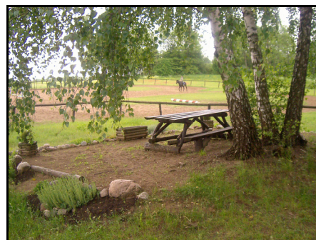
Rysunek 18. Miejsce do odpoczynku Figure 18. A place to rest