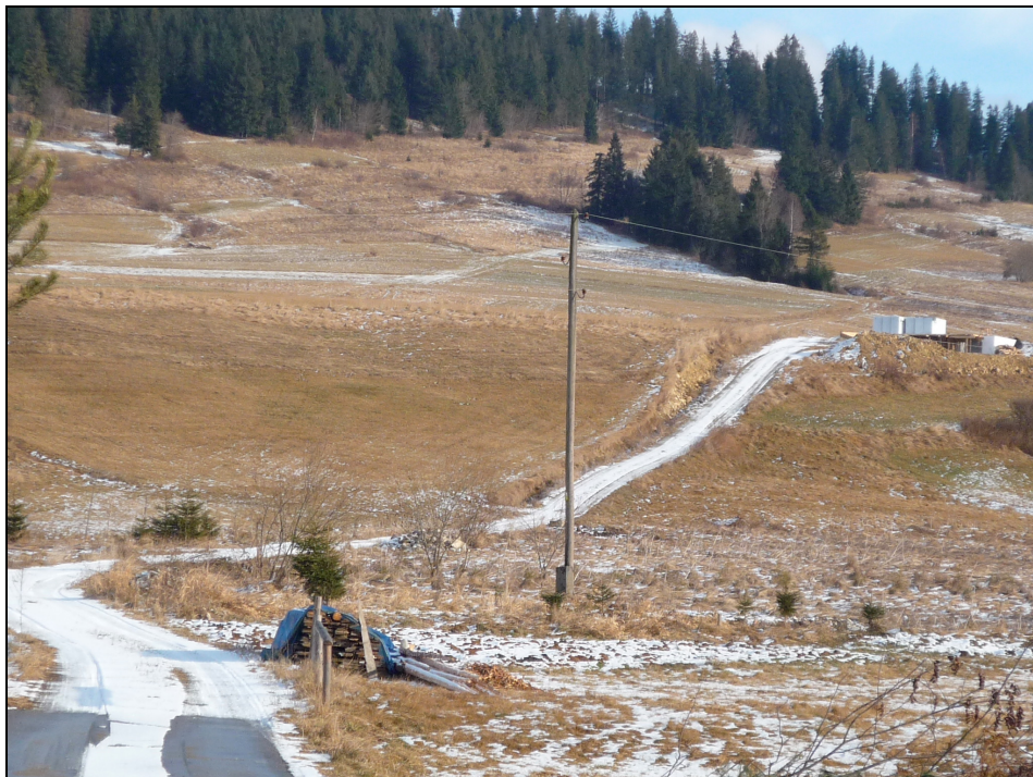
Fotografia 1. Widok drogi gruntowej stanowiącej dojazd do posesji, przeznaczonej w miejscowym planie zagospodarowania przestrzennego Czarna Góra – Gmina Bukowina Tatrzańska, częściowo na cele ciągu pieszego

Photo 1. View of ground road which is an access to the property, partly designed for pedestrian precinct in the local plan of spatial development Czarna Góra – Municipality of Bukowina Tatrzańska