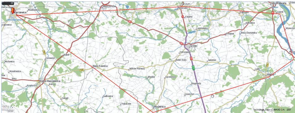
Rysunek 1. Obszar na którym rozmieszczono stacje meteorologiczne Figure 1. Area with the meteorological stations

Podstawę opracowania stanowiły pomiary opadów prowadzone w centralnej części Polski, w największym krajowym rejonie upraw sadowniczych. Na obszarze obejmującym około 1400 km 2 , leżącym pomiędzy miejscowościami Skierniewice, Biała Rawska, Mogielnica, Warka, Czersk i Tarczyn na terenie sadów produkcyjnych (lub doświadczalnych) umiejscowione są 34 automatyczne stacje meteorologiczne iMetos (Pessl Instruments, Austria). Deszczomierz o powierzchni zbierającej 250 cm 2 opadu był umieszczony na wysokości 2 m (rys. 1, tabela 1). Opady rejestrowano z częstotliwością co 60 minut przy minimalnej rozdzielczości pomiaru 0,2 mm. Analizowane dane pomiarowe obejmują okres od IV do X 2010 roku. Charakterystyki opadów dokonano oddzielnie dla poszczególnych punktów pomiarowych oraz łącznie dla całego analizowanego obszaru jako średnią arytmetyczną. Przebieg zmienności sum oraz intensywności opadów opisano za pomocą określenia maksimum, minimum, rozstępu oraz współczynnika zmienności analizowanych parametrów.