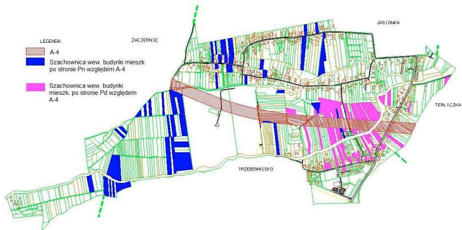
Figure 1. Spacious lay-out of grounds belonging to non-habitant owners in Nowa Wieś, municipality of Trzebowniko