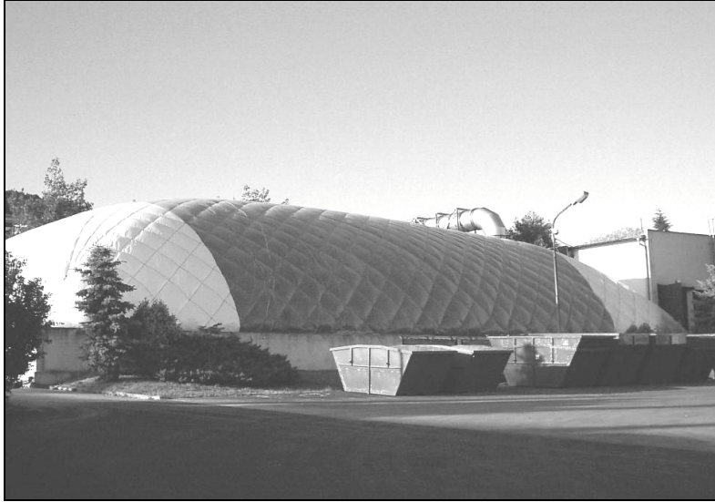
Fotografia 3. Folia z linami stalowymi Photo 3. Film of wire ropes