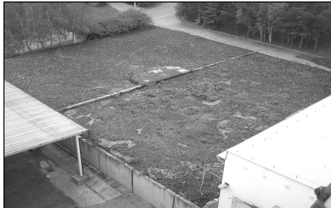
Fotografia 1. Zdjęcie powierzchni ziemnego biofiltra

Nieefektywność biofiltrów została potwierdzona na podstawie zdjęć termowizyjnych badanego biofiltra, gdzie miejsca z najwyższą temperaturą to tzw. kominy powietrzne, w których dochodzi do szybkiej filtracji powietrza.