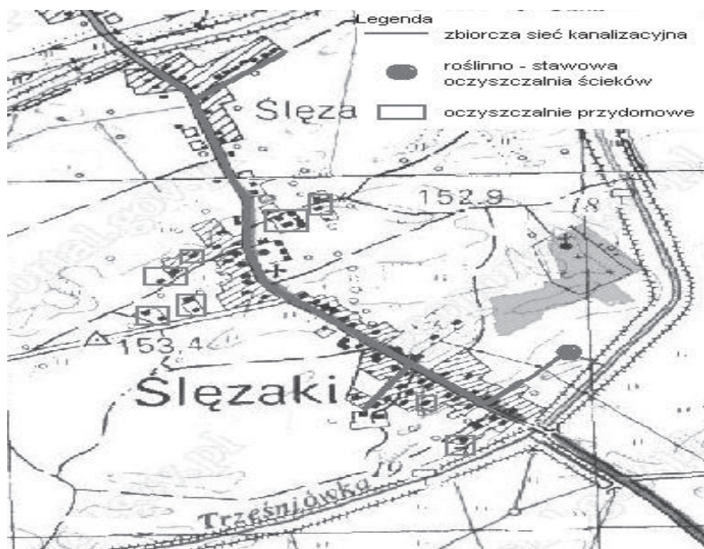
Rysunek 2. Koncepcja poprawy gospodarki ściekowej w sołectwie Ślęzaki [podkład mapowy: www.geoportal.pl ]

czalni może być rozwiązaniem tańszym niż odprowadzanie ścieków do istniejącego obiektu. Związane to jest z rozbudową nie tylko sieci kanalizacyjnej ale również oczyszczalni ścieków, której obecna przepustowość uniemożliwia przyjmowanie nieczystości z sąsiednich sołectw. W przypadku sołectwa Ślęzaki konieczna byłaby budowa sieci kanalizacyjnej na długości około 3 km i kolektora doprowadzającego ścieki do oczyszczalni o długości 1 km. Dla gospodarstw, które będą położone w znacznej odległości od głównego kolektora kanalizacyjnego (około 20 gospodarstw domowych), proponuje się budowę oczyszczalni indywidualnych (przydomowych), oczyszczających ścieki pochodzące tylko z jednego lub kilku sąsiadujących ze sobą gospodarstw domowych (rys. 2). Mimo, że koszt ich montażu jest większy od kosztów budowy szamba, to w dłuższej perspektywie czasu, z ekonomicznego punktu widzenia, są one lepszym rozwiązaniem niż zbiorniki bezodpływowe. Decydują o tym koszty eksploatacji, które dla przydomowej oczyszczalni są niższe niż dla powszechnie używanego na terenach wiejskich szamba.