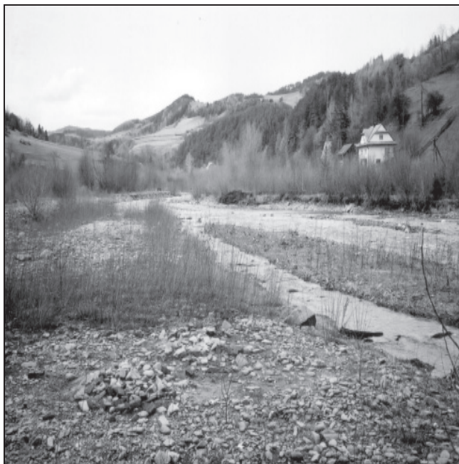
Rysunek 2. Przekrój pomiarowy na potoku Ochotnica Figure 2. The research cross section in the Ochotnica River