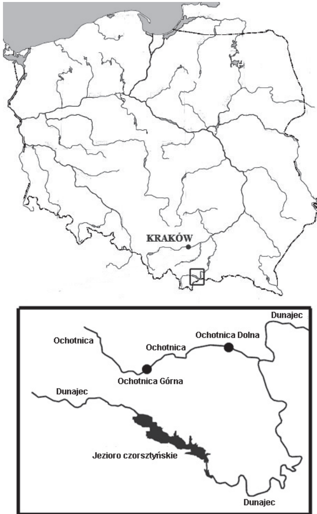
Rysunek 1. Położenie obiektu badań Figure 1. Location of the research region

Potok Ochoznica zaliczany jest typologicznie do rzek karpackich, których zasoby wodne są nierównomiernie rozłożone w czasie i przestrzeni. Charakteryzują się częstą zmianą stanów wód, znacznym potencjałem powodziowym oraz znacznymi procesami erozyjnymi brzegów i dna rzecznoego [Strategia 2008].