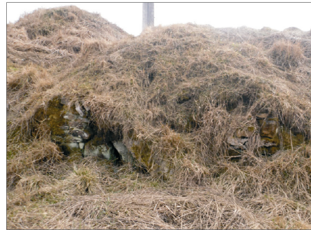
Rysunek 17. Piwnice w złym stanie technicznym. Figure 17. Cellars in very poor technical condition. Fot. 2010