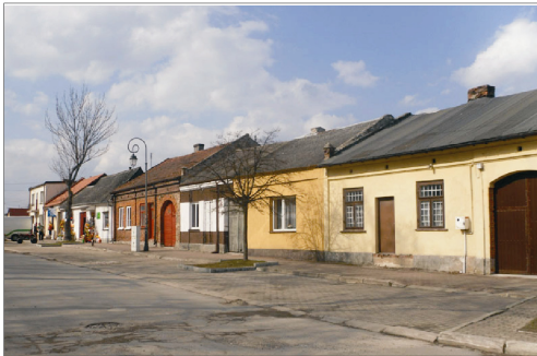
Rysunek 3. Pierzchnica - rynek. Figure 3. Pierzchnica - market square. Fot. 2010 r.