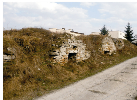
Rysunek 19. Zespoły piwnic. Figure 19. Cellars complex. Fot. 2010