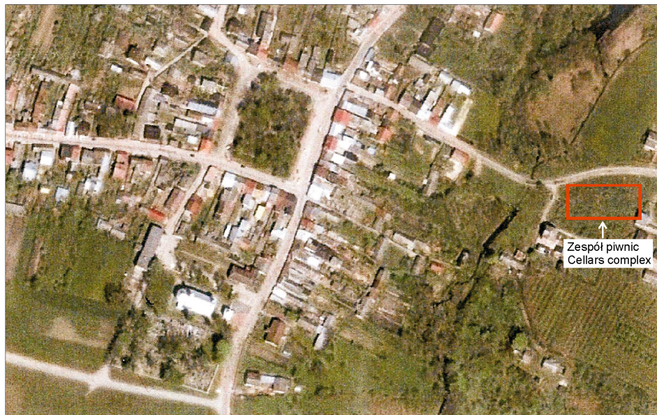
Rysunek 11. Zdjęcie satelitarne, 2009 r. Figure 11. Satellite photograph