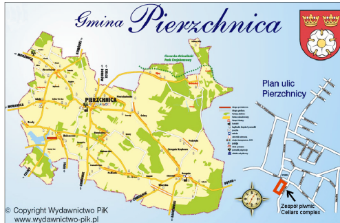
Rysunek 1. Gmina Pierzchnica. Figure 1. Pierzchnica community www.wydawnictwo-pik.pl