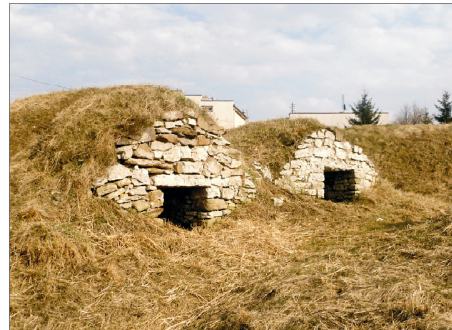
Rysunek 18. Zespoły piwnic. Figure 18. Cellars complex. Fot 2010