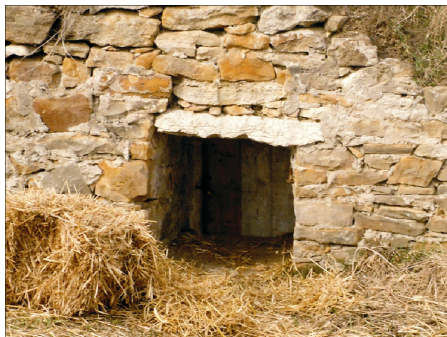
Rysunek 12. Wejścia do piwnic. Figure 12. Cellar's entrance. Fot. 2010