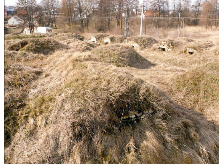
Rysunek 20. Widok piwnic. Figure 20. Cellars landscape. Fot. 2010