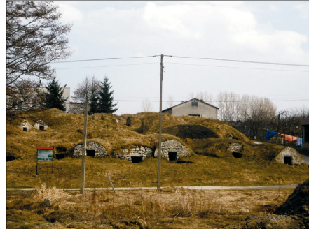
Rysunek 22. Góra Piwniczna. Figure 22. Cellar Mountain. Fot. 2010