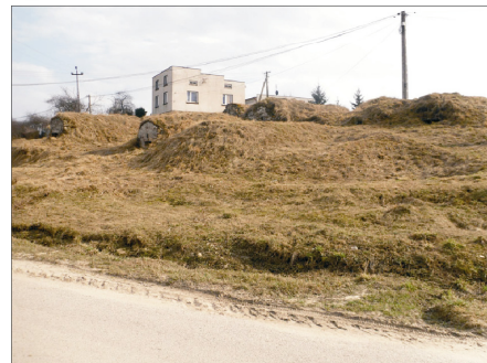
Rysunek 23. Góra Piwniczna. Figure 23. Cellar Mountain. Fot. 2010