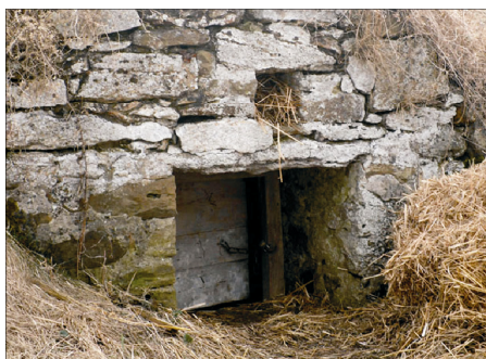
Rysunek 14. Piwnice z drzwiami. Figure 14. Cellars front walls with doors. Fot. 2010