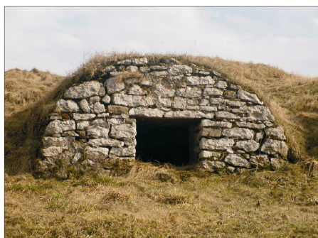
Rysunek 15. Piwnice w dobrym stanie technicznym. Figure 15. Cellars in good technical condition. Fot. 2010