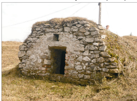
Rysunek 13. Piwnice z otworami wentylacyjnymi. Figure 13. Cellars front walls with ventilating hole. Fot. 2010