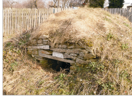
Rysunek 16. Piwnice w średnim stanie technicznym. Figure 16. Cellars in poor technical condition. Fot. 2010