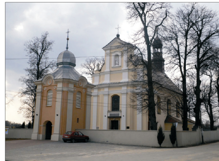
Rysunek 4. Pierzchnica - kościół. Figure 4. Pierzchnica - church. Fot. 2010 r.