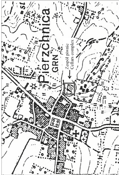
Rysunek 7. Fragment mapy topograficznej 1:25 000, lata 1980-1980. Starostwo Powiatowe w Kielcach Figure 7. Fragment of communication, topographic map 1: 25 000, years 1980-1985