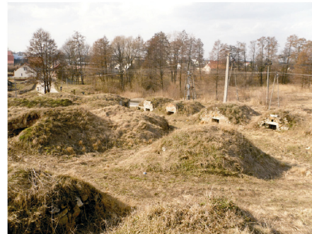
Rysunek 21. Widok piwnic. Figure 21. Cellars landscape. Fot. 2010