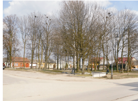
Rysunek 2. Pierzchnica - rynek. Figure 2. Pierzchnica - market square. Fot. 2010 r.