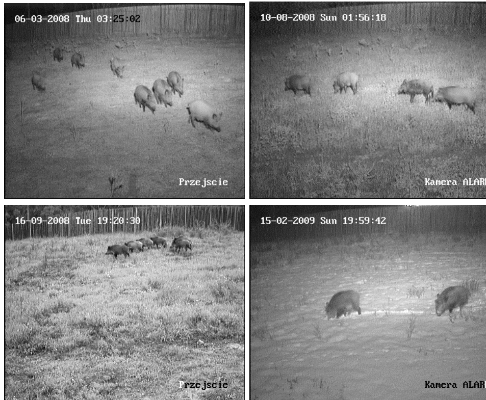
Fotografia 2. Przykładowe sekwencje filmowe migrujących dzików przejściem dla zwierząt nad drogą krajową nr 5 (uwaga data i godzina migracji widoczna na zdjęciach)

Photo 2. Exemplary film sequences of wild boars migrations by animal crossing built over trunk road no.5 (notice: date and time of migrations visible on the photo)