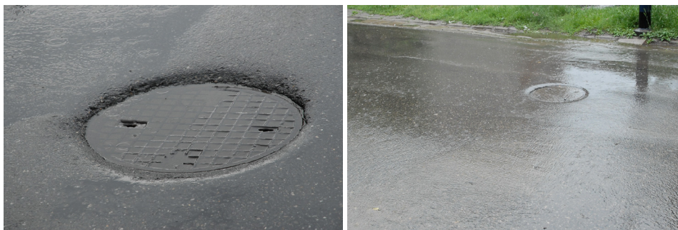
Rysunek 1. Przykłady włazów kanalizacyjnych usytuowanych poniżej powierzchni terenu w chwili wystąpienia opadu atmosferycznego Figure 1. Examples of the sewerage system hatches located below the area surface during the precipitation

Obserwacje prowadzone w terenie, w okresie opadów deszczu, dają podstawę do przypuszczeń, że znaczna część wód deszczowych przedostaje się do kanalizacji przez otwory we włazach studzienek kanalizacyjnych usytuowanych poniżej poziomu terenu (rys. 1).