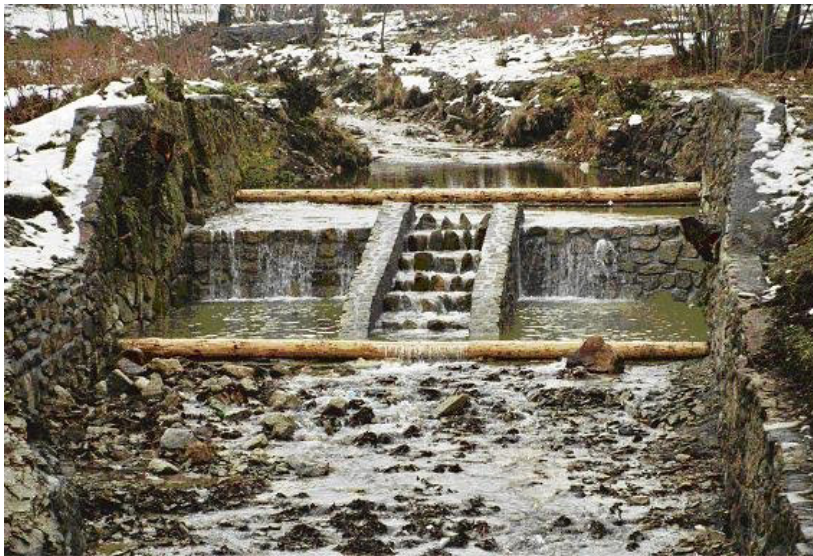
Fotografia 2. Przepławka ryglowa, widok od wody dolnej, Czarny Potok (autor Niesobski) Photography 2. The half-timbered fish passed, view from downstream water stage, stream Czarny Potok (author Niesobski)