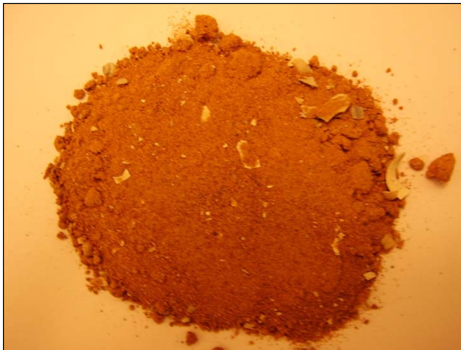
Rysunek 2. Wysuszona próbka osadów z jeziora Dąbie Figure 2. Dry mud sample from Lake Dąbie

Widok próbki osadów po wysuszeniu przedstawia rysunek 2. W wysuszonym materiale widać dużą zawartość części muszli.