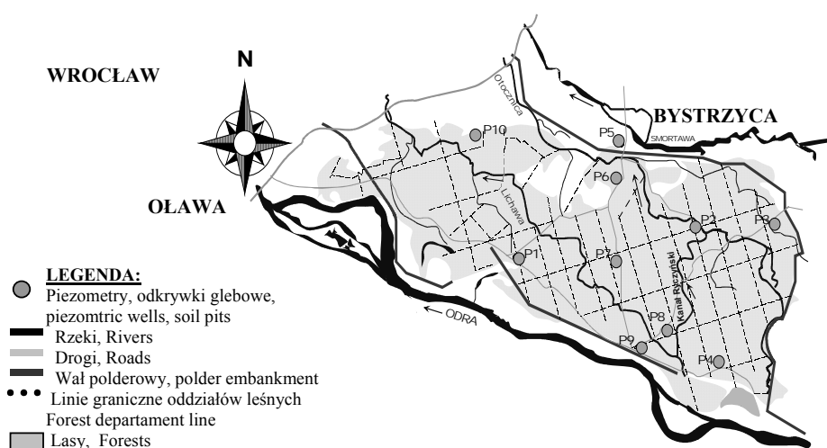
Rysunek 1. Mapa sytuacyjna terenu badań z zaznaczoną siecią monitoringu lokalnego Figure 1. Case study area location map with marked local monitoring network

Warunki wodne oceniono na podstawie cotygodniowych pomiarów głębokości zalegania zwierciadła wód gruntowych w sieci 10 piezometrów (rys. 1). Diagnozę typologiczną dotyczącą siedlisk oparto na elementach drzewostanu, runa i gleby (wykonano 9 odkrywek glebowych, dla których opisano profil glebowy, wykonano analizę składu granulometrycznego, określono typ i rodzaj gleby wg „Klasyfikacji gleb leśnych Polski” [Biały i in. 2001]). Oceniono również stopnie i warianty uwilgotnienia siedlisk w zależności od wpływu wody gruntowej na siedlisko [Trampler i in. 1990].