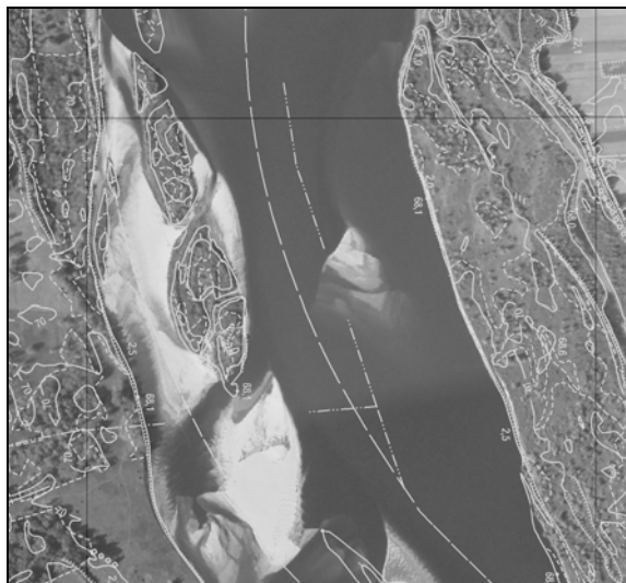
Rysunek 4. Przykład naturalnej akumulacji Figure 4. An example of natural accumulation

Na obserwowanym odcinku Wisły obserwuje się ramiona zasypane rumowiskiem nawet tam, gdzie nie było żadnych budowli (rys. 4).