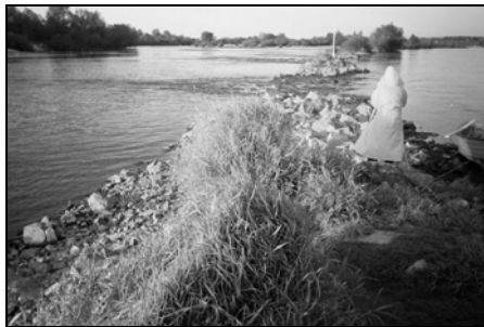
Rysunek 3. Uszkodzenie tamy podłużnej powyżej wlotu do ramienia Figure 3. Damage of longitudinal structure upwards of the side arm

ramiona i otoczenie wyspy zasypane piachem, do rzędnej zbliżonej do poziomu wody średniej rocznej. Jest to rezultatem naturalnego procesu zmian położenia nurtu w nieuregulowanej w dostatecznym stopniu rzece i związanej z tym zmiany miejsca akumulacji oraz erozji.