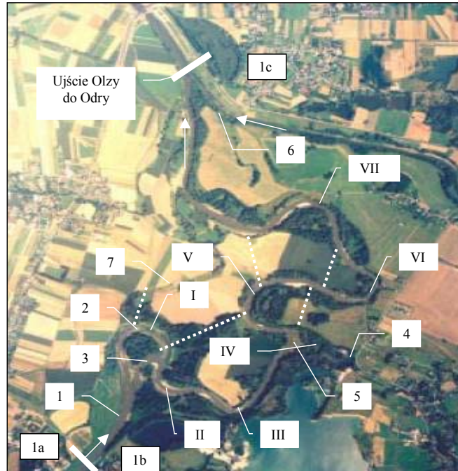
Fotografia 1. Odcinek Odry od Chałupki do ujścia Olzy gdzie: I, II, ... – nr meandry, 1 – rzeka Odra, 1a – miejscowość Chałupki, 1b – miejscowość Bohumin, 1c – miejscowość Olza, 2 – stare koryto meandry nr I, 3 – nowe koryto meandry nr I, 4 – stare koryto meandry nr IV, 5 – nowe koryto meandry nr IV, 6 – rzeka Olza, 7 – poprzednie pozameandrowe koryto Odry, ----miejsca i odcinki Odry, gdzie mogą nastąpić potencjalne przerwa- nia koryta, skrócenie trasy i przerzuty wód powodziowych Photography 1. Odra section from Chałupki to Olza mouth where: I, II, ... – no. of meander, 1 – Odra river, 1a – Chałupki town, 1b – Bohumin town, 1c – Olza town, 2 – old channel of meander I, 3 – new channel of meander I, 4 – old channel of meander IV, 5 – new channel of meander IV, 6 – Olza river, 7 – former aftermeander Odra channel, ----places and sections of Odra river, where can arrive potential channel breaks, shortening of the course and transfer of the floods

Rzeka na tym odcinku znajduje się pod silnym wpływem działań człowieka (obwałowania i zabudowa mostami). Tuż poniżej tej zabudowy występuje siedem unikalnych meandrów. Dwa z nich tj. I i IV na skutek powodzi zostały przerwane (w 1997 r. i 1967 r.) [Bartnik i in. 2006]. Wskutek tego powstały dwa nowe koryta (odnogi tych meandrów) o szerokości zbliżonej do starych, które obecnie tworzą