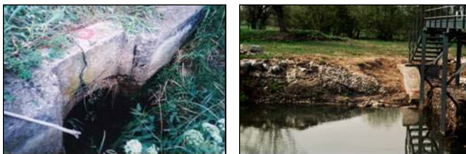
Fot. 1. Uszkodzone budowle hydrotechniczne Photo 1. Hydrotechnical structures damaged

przepustu lub zatrzymywania się śmieci, gałęzi i roślinności na przelewie budowli piętrzącej, ale doprowadzić może do ich zniszczenia (fot. 1).