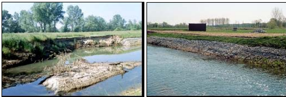
Fot. 2. Zabudowa wyrwy na skarpie poniżej budowli piętrzącej przy użyciu elementów siatkowo kamiennych

Photo 2. Building of breach on the slope below rising structure by use the netlike-stone elements