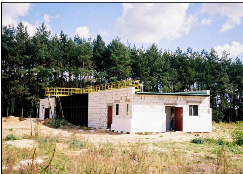
Rysunek 2. Nowo wybudowana oczyszczalnia ścieków w Domaniowie