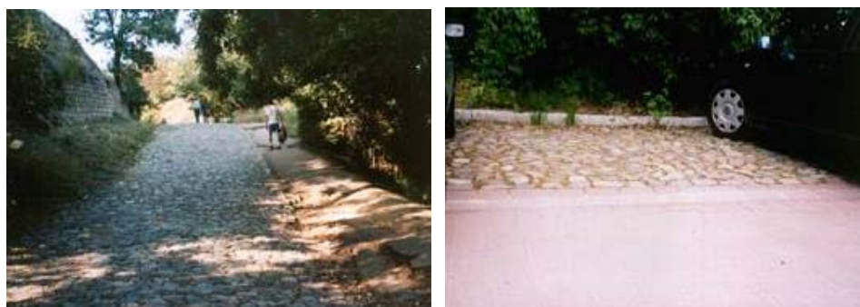
Rysunek 3. Przykłady nawierzchni przepuszczalnych wykonanych z kamienia polnego

Innym bardziej ekonomicznym rozwiązaniem jest wykonanie nawierzchni parkingu lub ścieżek komunikacyjnych z warstwy żwirowej lub kamienia polnego (rys. 3). Porowate nawierzchnie drogi np. porowaty asfalt są coraz częściej substytutem dla tradycyjnych materiałów stosowanych w budownictwie drogowym, zalecane przede wszystkim na powierzchni ulic o małym natężeniu ruchu.