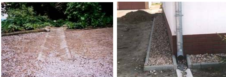
Rysunek 4. Odprowadzanie wód opadowych za pomocą korytek betonowych

Wody opadowe z dachów mogą być odprowadzane za pomocą specjalnych kształtek betonowych, dzięki którym woda podlega wsiąkaniu do gruntu jak najdalej od ścian i fundamentów budynków. Wodę deszczową powinno się odprowadzić minimum na odległość 1 m od ściany budynku. Na końcu ciągu korytek betonowych wykonuje się urządzenia chłonne wód deszczowych. Przy powierzchniowym odprowadzaniu wód należy zabezpieczyć teren przed erozją gruntu, co może powodować powstawanie zagłębień (rys. 4).