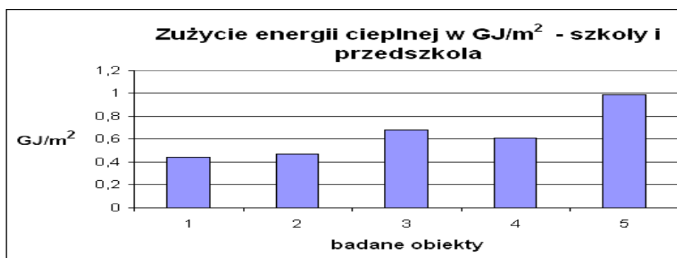
Rysunek 2. Zużycie energii cieplnej w budynkach szkolnych i przedszkolnych, GJ/m^2

Ilustrację zużycia energii cieplnej w budynkach szkolnych i przedszkolnych przedstawiono na rysunku 2 w odniesieniu do powierzchni, GJ/m^2 .