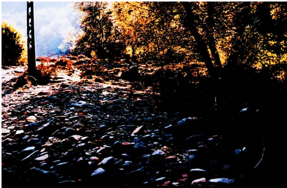
Fotografia 1. Rumosz skalny w potoku