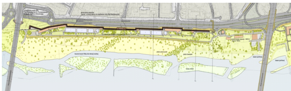
Rysunek 4. Schemat uformowania bocznego koryta Wisły i wysp w rejonie Saskiej Kępy (Damiński i in. 2008).

Figure 4. Outline of formation a lateral Vistula riverbed and islands in Saska Kępa area