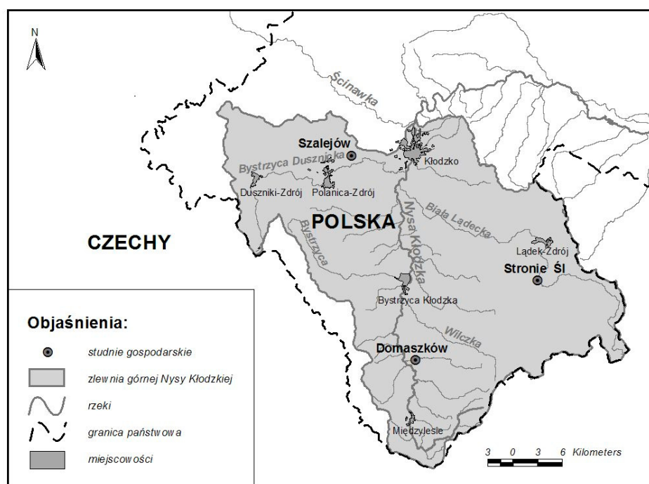
Rysunek 1. Lokalizacja wybranych studni gospodarskich pomiaru zwierciadła wód podziemnych w obrębie zlewni górnej Nysy Kłodzkiej

W opracowaniu wykorzystano dane pomiarowe poziomu zalegania zwierciadła wód podziemnych w trzech studniach gospodarskich położonych w obrębie zlewni Nysy Kłodzkiej w miejscowościach: Domaszków, Szalejów Górny, Stronie Śląskie (rys. 1.). Okresem wybranym do analizy były lata hydrologiczne 1971–2005, czyli rozpatrywany był 35-letni ciąg danych.