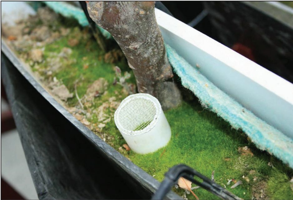
Fotografia 1. Pobieranie próbek do badań akarologicznych w rizoboksach z roślinami jabłoni

układzie wariantów: C – kontrola (bez nawożenia), N – nawożenie mineralne (standardowe nawożenie mineralne NPK, w dawkach 70/60/120 kg składnika na ha), O – nawożenie obornikiem (dawka 30 t/ha), M – aplikacja biopreparatu Mycosat (20 g/roślinę + ½ dawki obornika, 2,5 g na rizoboks), H – aplikacja biopreparatu Humus Active 2% + Aktywit PM 1%. Rizoboksy o wymiarach 60 cm × 50 cm × 8 cm wykonano z PCV (fot. 1). Glebę do doświadczenia pobrano z warstwy ornej Sadu Doświadczalnego w Dąbrowicach. Skrzynie z drzewkami ustawiono na stelażach pod kątem 60°. W okresie wegetacji drzewka chroniono przed chorobami i szkodnikami oraz nawadniano kropłowo.