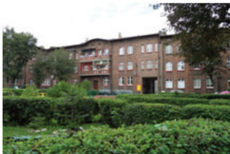
Rysunek 5. Wnętrze bloku zagospodarowane na rekreację dla mieszkańców (fot. autorki, sierpień 2012)

Figure 5. The interior of a block redeveloped for the purpose of recreation for the residents (photo by the authoress, August 2012)