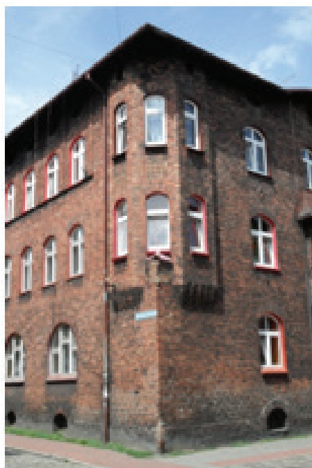
Rysunek 11. Wykusz narożny detalem architektonicznym (fot. autorki, sierpień 2012)

Figure 11. Corner bay window as an architectural detail (photo by the authoress, August 2012)