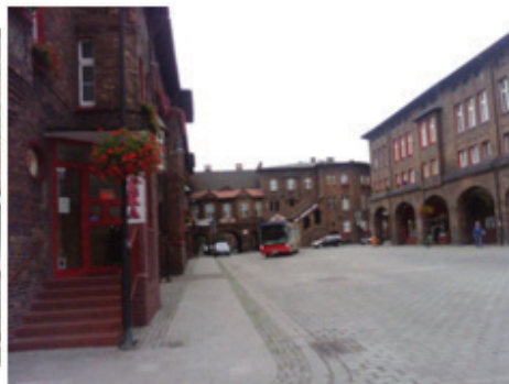
Rysunek 8. Miejsce publiczne – Plac Wyzwolenia

Figure 7. The spatial order apparent in the Nikiszowiec architecture, with the so-called familoki maintaining a uniform composition