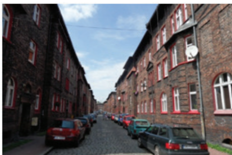
Rysunek 7. Ład przestrzenny panujący w zabudowie Nikiszowca, „familoki” utrzymane w jednakowym charakterze (fot. autorki, sierpień 2012)

Figure 6. A connector between each block, built above the street (photo by the authoress, August 2012)