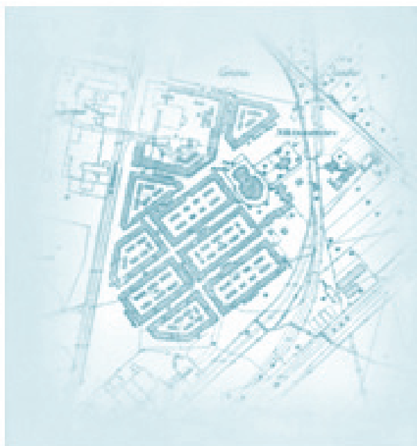
Rysunek 3 Plan Nikiszowca, stan po zakończeniu budowy, lata trzydzieste XX wieku (wł. KWK „Wieczorek” [Tofilska J., 2009])

Celem poprawy bezpieczeństwa w listopadzie 2010 roku zainstalowano w dzielnicy system monitoringu, dzięki funduszom pozyskanym przez organizatorów „Jarmarku na Nikiszu”. Problemy społeczne Nikiszowca to: bezrobocie, niska aktywność społeczna oraz przestępczość. Dzielnica odczuwa także brak centrum kulturalnego i problem mieszkaniowy. Nikiszowiec postrzegany jest jako dzielnica niebezpieczna ze względu na przestępczość. Najczęściej dochodzi do wykroczeń i przestępstw mających charakter wandalizmów (wybijanie szyb, podpalanie koszy na śmieci, kradzieże). Osiedle to traktować należy jako system społeczny [Ziółkowski 1963].