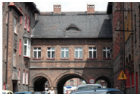
Rysunek 6. Łącznik pomiędzy poszczególnymi blokami, nad ulicą (fot. autorki, sierpień 2012)

Figure 5. The interior of a block redeveloped for the purpose of recreation for the residents (photo by the authoress, August 2012)