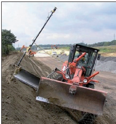
Rysunek 3. Przechył masztu równiarki [www.topcon.eu]