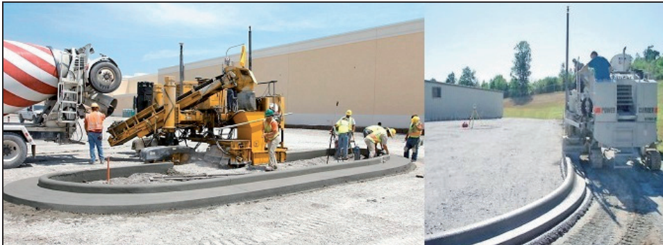
Rysunek 1. Maszyny układające krawężniki [ http://www.gomaco.com , http://heg.baumpub.com ]

stujące tachymetry zrobotyzowane. Ewentualnie można je zastosować łącznie z czujnikami pozwalającymi uzyskać wyższe dokładności wyznaczania wysokości niż z pomiarów RTK GPS czy RTN. Takim odrębnym rozwiązaniem jest mmGPS, które wykorzystuje laser powierzchniowy LaserZone emitujący wiązkę lasera o wysokości 10 m oraz czujnik montowany razem z anteną satelitarną. System współpracuje z odbiornikiem satelitarnym zwiększając dokładność wyznaczania wysokości w pomiarach satelitarnych.