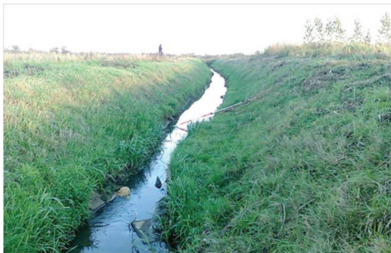
Rysunek 1. Osunięcie skarp rowu R. Odcinek poniżej przekroju 4+680 zaznaczonego na rysunku 2