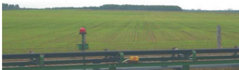
Fotografia 3. Sołectwo Ostrowite – ukształtowanie powierzchni terenu i jego użytkowanie po rekultywacji (fot. A. Fiszka Borzyszkowska; 28 września 2014)