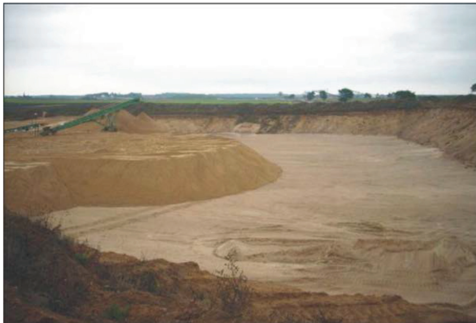
Fotografia 1. Sołectwo Ostrowite – wyrobisko po eksploatacji kruszywa zasypywane drobnoziarnistym, niewykorzystanym piaskiem (28 września 2014)

Photo 1. Ostrowite village – excavation after aggregate exploitation covered with fine, unused sand (September 28, 2014)