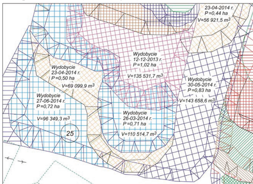
Rysunek 3. Zmienność powierzchni objętej eksploatacją kruszywa i miesięczna wielkość wydobycia na przykładzie złoża „Ostrowite” (na podstawie dokumentacji przedsiębiorstwa Lafarge)

Przemiany krajobrazu zachodzące w gminie Lipnica w efekcie eksploatacji kruszyw, a następnie rekultywacji terenów pogórnich dobrze ilustrują obserwacje przeprowadzone w latach 2013 i 2014. Przed eksploatacją był to teren pagórkowaty, użytkowany jako pola orne, z nielicznymi samotnie rosnącymi sosnami. Na obszarze górniczym „Ostrowite” eksploatacją kruszyw obejmowano w kolejnych miesiącach powierzchnię od 0,15 ha (w marcu) do 1,8 ha (w kwietniu) (tab. 1), a ilość pozyskiwanego surowca zmieniała się od 23 t (marzec 2013) do 269 t (październik 2013), (tab. 2, rys. 3).