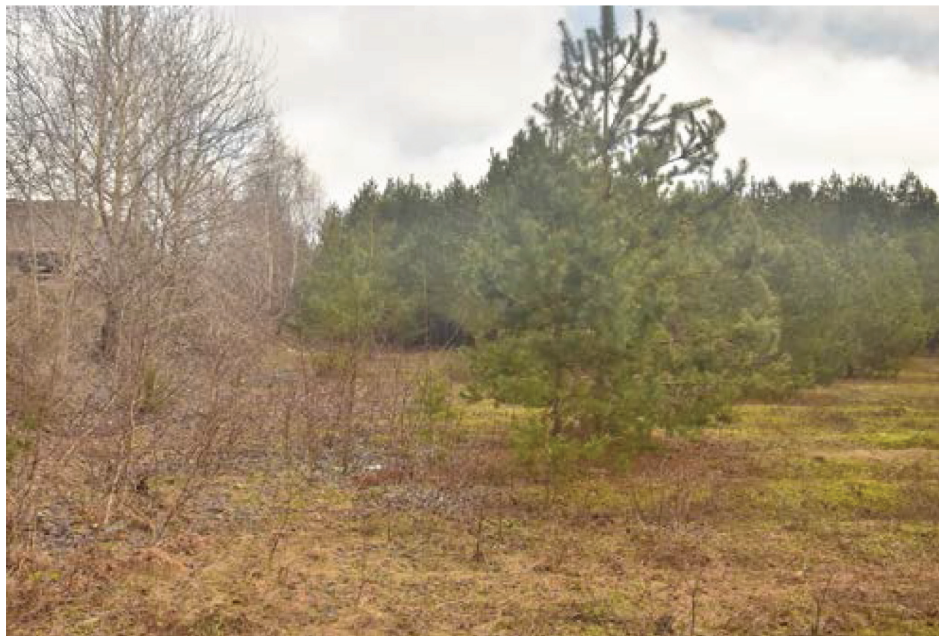
Fotografia 4. Sołectwo Ostrowite – teren poeksploatacyjny uformowany w latach osiemdziesiątych ubiegłego wieku (fot. M. Majewski; 2 lutego 2018)

jezior i zabytkowych wiejskich kościołów. Być może dlatego, jak dotąd, żaden z rolników na tym obszarze nie zdecydował się na przekształcenie swego gospodarstwa w agroturystyczne.