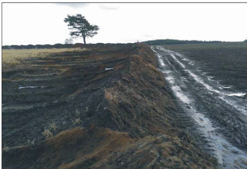
Fotografia 2. Sołectwo Ostrowite; pierwszy etap przygotowywania terenu do eksploatacji: zdejmowanie i zwałowanie warstwy próchnicznej gleby (28 września 2014)