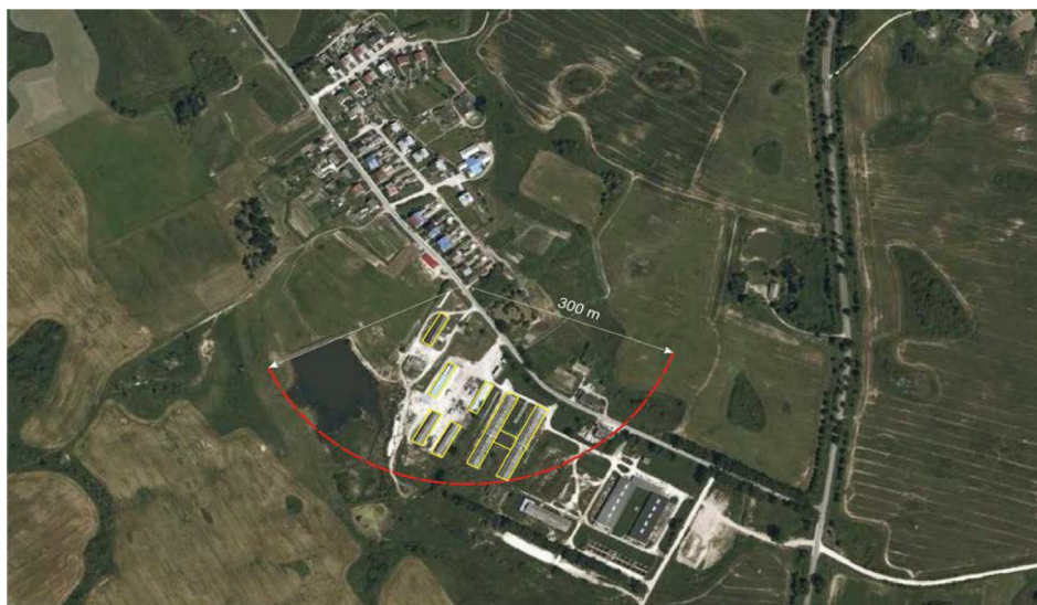
Rysunek 1. Lokalizacja fermy względem osiedla z oznaczoną strefą odległości 300 m od najbliższych zabudowań mieszkalnych

Ferma we wsi Wronki położona w gminie Gołdap w odległości około 9 km od miasta Gołdap. W czasach PGR funkcjonująca jako ferma tuczu trzody chlewnej. Wiek zabudowań szacowany jest na ok. 40 lat. Przez długi czas budynki fermy nie były użytkowane. Dopiero nowy dzierżawca rozpoczął przygotowania do wznowienia hodowli trzody chlewnej na skalę przemysłową. Odległość najbliższych położonych zabudowań fermowych od zabudowy mieszkaniowej wynosi ok. 50m, a w odległości 300 m od pierwszych domów mieszkalnych (czerwona linia na rys. 1) zlokalizowana jest ponad połowa łącznej powierzchni budynków hodowlanych. Pokazana na rys. 1 granica 300 m nie wynika z żadnych limitów określonych w przepisach prawa. Jest ona wynikiem analizy przeprowadzonych postępowań środowiskowych, w których celem było ustalenie zasięgu występowania uciążliwości przekraczających wartości progowe dla zabudowy mieszkaniowej. Pod uwagę wzięto również uciążliwości trudne do sparametryzowania, ale niezwykle istotne w tym konkretnym przypadku, jakimi są odory (wyziewy) towarzyszące przemysłowej hodowli trzody chlewnej.