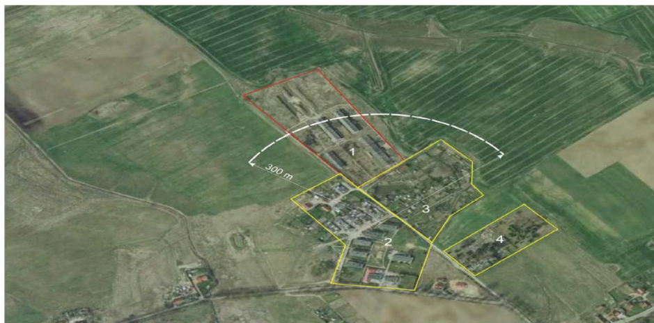
Rysunek 3. Lokalizacja fermy w Sząbruku. Oznaczenia: 1 – teren fermy, 2 – osiedle mieszkaniowe, 3 – ogrody działkowe, 4 – cmentarz parafialny

Figure 3. The location of a breeding farm in Sząbruk. Legend: 1 – the farm's premises, 2 – housing estate, 3 – allotment garden, 4 – parish cemetery