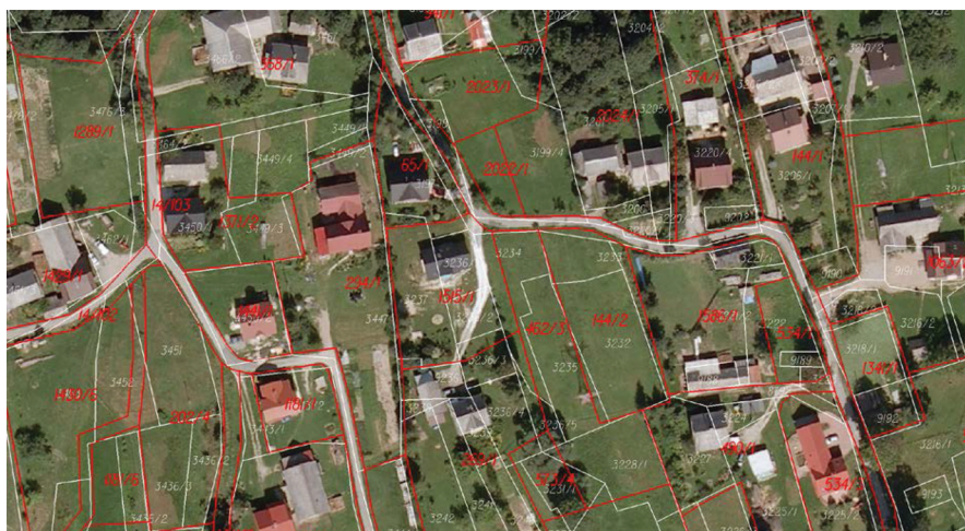
Rysunek 4. Przykład zmian układu granic ewidencyjnych, na obszarze zabudowanym, w wyniku scalenia gruntów (wieś Łętownia). Kolorem białym przedstawiono granice przed scaleniem, kolorem czerwonym – po scaleniu.