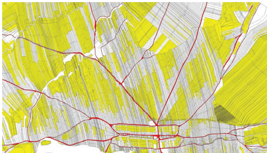
Rysunek 3. Przykład braku dostępności działek do sieci drogowej (zaznaczone kolorem żółtym). Wieś Nowa Biała, powiat nowotarski.