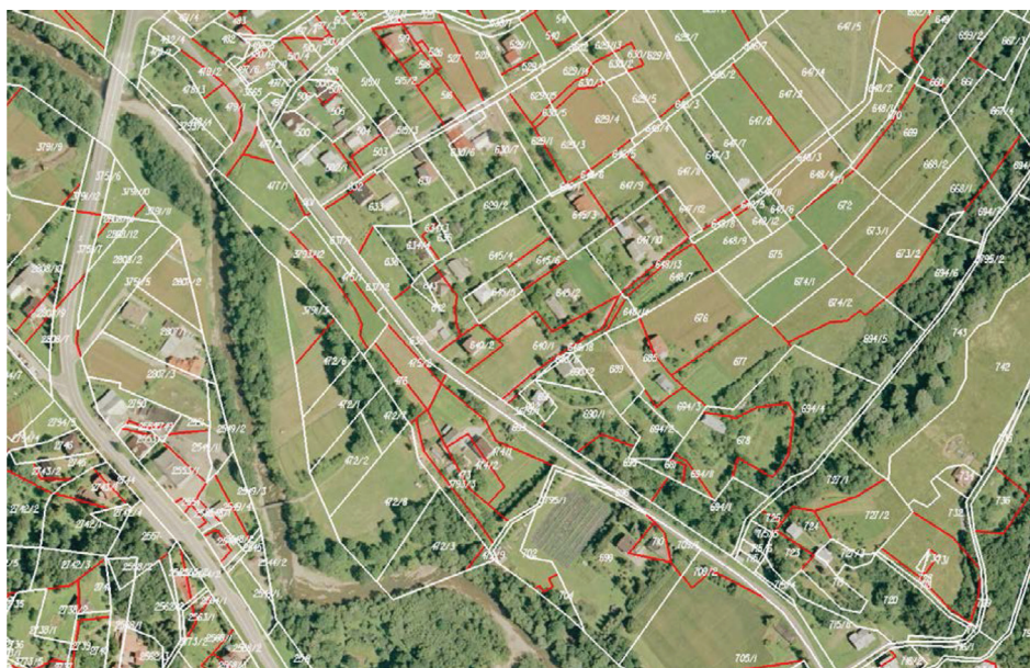
Rysunek 5. Przykłady bezpośredniego sąsiedztwa działek należących do tego samego właściciela (kolor czerwony) – wieś Sękowa, powiat gorlicki, województwo małopolskie.

Ostatnim, istotnym czynnikiem, wprowadzenia procedur scalań katastralnych jest możliwość likwidacji zjawiska fikcyjnego rozdrobnienia gruntów , za jakie należy uznać występowanie sąsiadujących ze sobą działek należących do tej samej jednostki rejestrowej (rysunek 5).