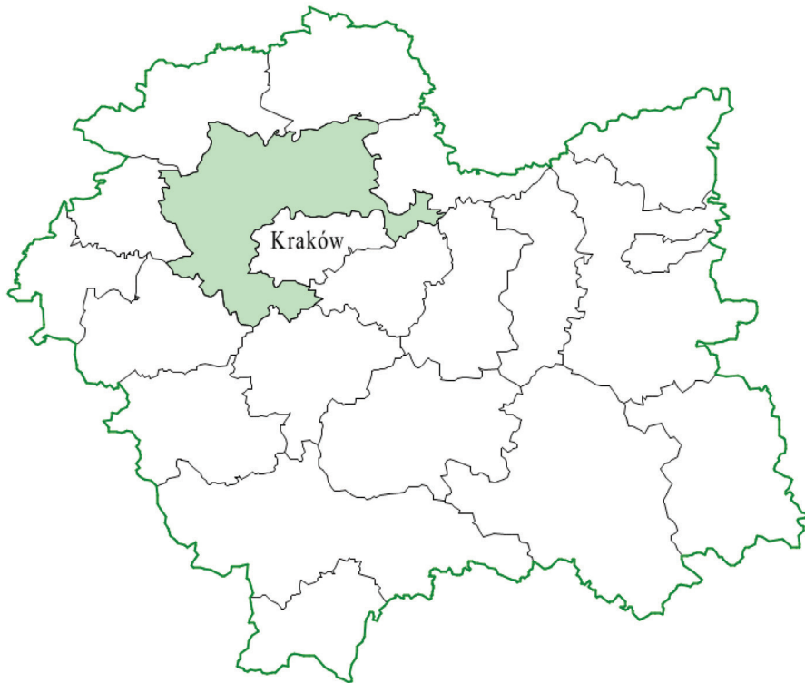
Rysunek 1. Położenie powiatu krakowskiego w woj. małopolskim.

km 2 . Wynika stąd, że w ciągu tego okresu liczba ludności powiatu zwiększyła się o ok. 26,7 tys. osób. Na terenie powiatu zlokalizowane są dwa lotniska, a obszar ten znajduje się w bezpośrednim oddziaływaniu obszaru metropolitalnego Krakowa. Wszystko to świadczy o dużym potencjale rozwojowym badanego terenu.